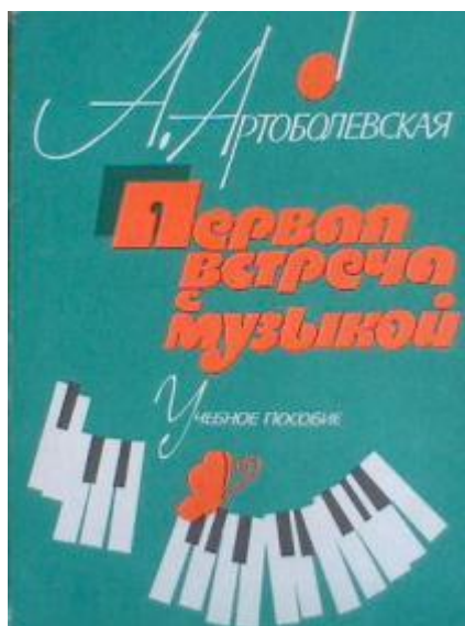
Рис. 1. Учебное пособие А.Д. Артоболевской

Анна Даниловна своим педагогическим опытом дает понять, что к каждому ребенку можно найти подход – «подобрать ключ», независимо от музыкальных возможностей, незаметно ввести мир звуков и пробудить любовь к музыке. «Попробуйте околдовать ребенка музыкой, как интересной сказкой, не имеющей конца».