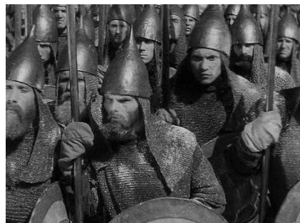
Рис. 1. Кадры из фильма С. Эйзенштейна «Александр Невский»

Информационная функция в нашем исследовании направлена на расширение и компенсацию знаний и умений обучающихся в области познания и использования в своей творческой деятельности культурно-исторического аспекта военной атрибутики Отечества. С педагогической точки зрения информационная функция важна и реализуется не только изучением или демонстрацией одной темы или технологии, но и с помощью актуализации имеющихся у учащихся компетенций, то есть непосредственно обращение к наличию к собственной компетентности. Например, содержательный аспект программы нашей студии отражает возможность пополнить знания обучающихся о секретах жизнеобеспечения русских воинов путем создания военной атрибутики. Это, прежде всего история технологии создания видов кольчуги. Уже с первых занятий обучающиеся узнают, что по древнерусским понятиям защитное снаряжение без шлема называлось доспехами. Позднее этим термином стали называть всё защитное снаряжение воина. Главным элементом русских доспехов длительное время была кольчуга. Она использовалась с X до XVII века. Кольчуга изготовлялась из металлических колец, которые были склепаны или сварены между собой. В X–XI веках она имела форму длиннополой рубахи с короткими рукавами. С XII века вид кольчуги изменился, у нее появились длинные рукава, а для защиты шеи и плеч – кольчужная сетка-бармица. В качестве примера может стать картина В. Васнецова «Богатыри».