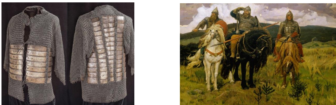
Рис. 2. Разновидности кольчуги и картина В. Васнецова «Богатыри»

В картине В. Васнецова богатыри одеты в защитные одежды, характерные для указанного выше исторического времени.