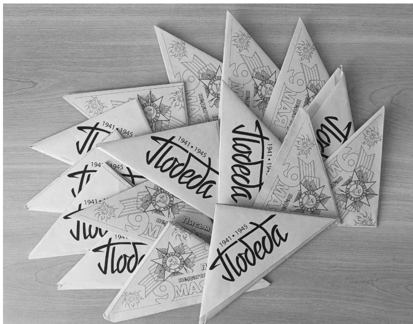
Рис. 1. Письма педагогам-героям от членов клуба «Педагог»

По итогам заседания клуба было проведено анкетирование. Подавляющее большинство студентов отметили значимость мероприятия, его воспитательный потенциал (рис. 2).