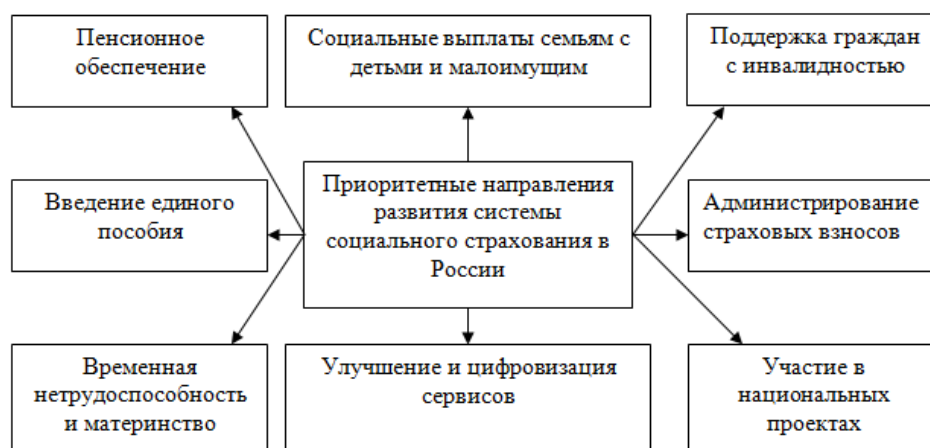
Рис. 2. Приоритетные направления развития системы социального страхования в России [1]

К приоритетным направлениям развития системы социального страхования следует отнести: пенсионное обеспечение, социальные выплаты семьям с детьми и малоимущим, поддержка граждан с инвалидностью, введение единого пособия, администрирование страховых взносов, временная нетрудоспособность и материнство, улучшение и цифровизация сервисов, а также участие в национальных проектах (рис. 2).