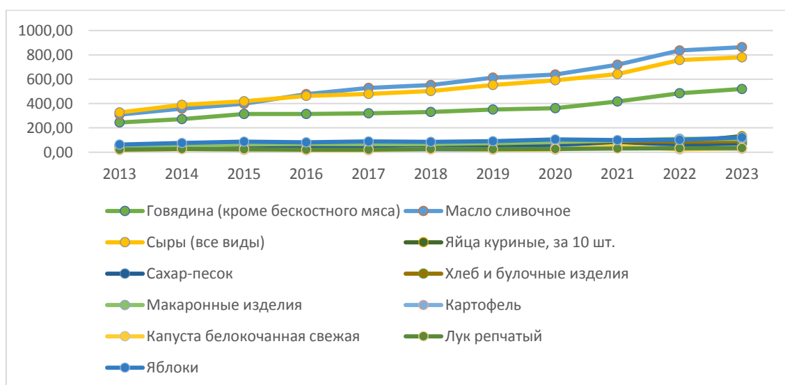
Рис. 3. Динамика средних потребительских цен

Далее необходимо изучить средние цены потребления на первичные продукты питания в РФ за период 2013–23 гг. (рис. 3).