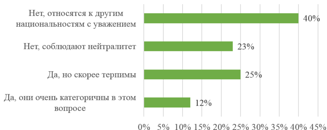
Рис. 2. Распределение ответов на вопрос

Смысловым индикатором также является проявление нетерпимости к людям другой национальности. Большинство респондентов ответили, что в их окружении к другим национальностям относятся с уважением (рисунок 2).