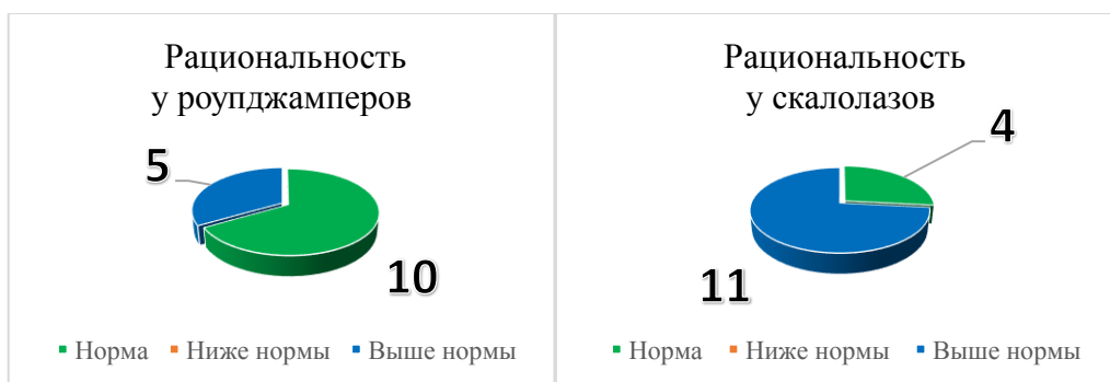
Рис. 1. Результаты исследования характеристики «Рациональность» (по методике «Личностные факторы принятия решений» Т.В. Корниловой)

Обратимся к результатам исследования, посвященного изучению личностных факторов принятия решений групп роупджамперов и скалолазов (рис. 1, 2).