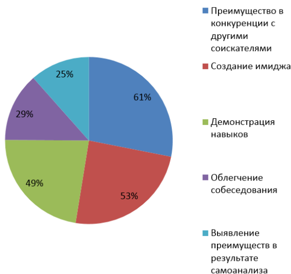
Рис. 3. Чем портфолио помогает в построении карьеры?

Проведен опрос выпускников 2025 г. с целью определения, чем оно может помочь в построении карьеры. В опросе участвовало 64 выпускника. Ответы свидетельствуют: преимущество в конкуренции с другими соискателями – 61%, создание имиджа – 53%, демонстрация навыков – 49%, облегчение собеседования – 29%, выявление преимуществ в результате самоанализа – 25%.