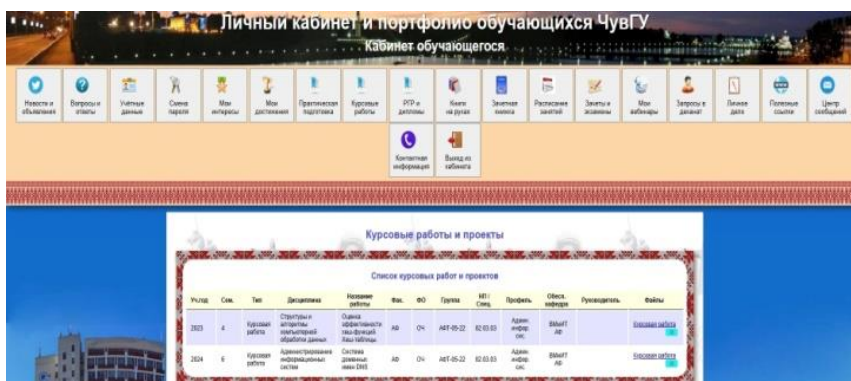
Рис. 1. Личный кабинет и портфолио обучающегося: курсовые работы и проекты

Автор ранее обращался к вопросу обеспечения эффективного трудоустройства выпускников вуза [9, с. 55]. В Алатырском филиале ЧГУ система учета результатов обучающихся существует и в ней можно отследить, например, успеваемость в зачетной книжке. Содержание портфолио сочетает как достижения, так и результаты учебной работы.