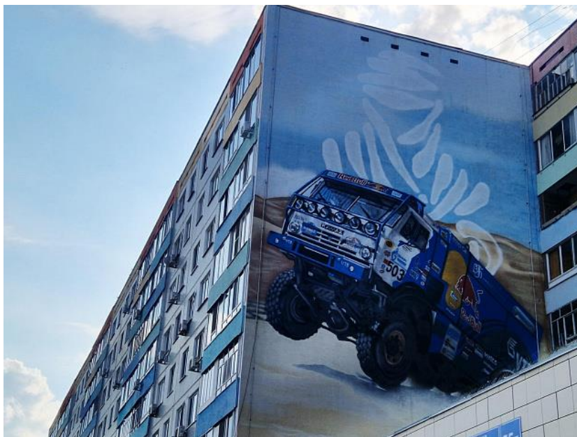
Рис. 2. «КамАЗ»

Благодаря таким проектам Набережные Челны постепенно становятся частью общенационального тренда на преобразование городской среды через уличное искусство [4]. Эти примеры показывают, что роспись может выполнять не только декоративную функцию, но и служить средством повышения социальной значимости пространства [5].