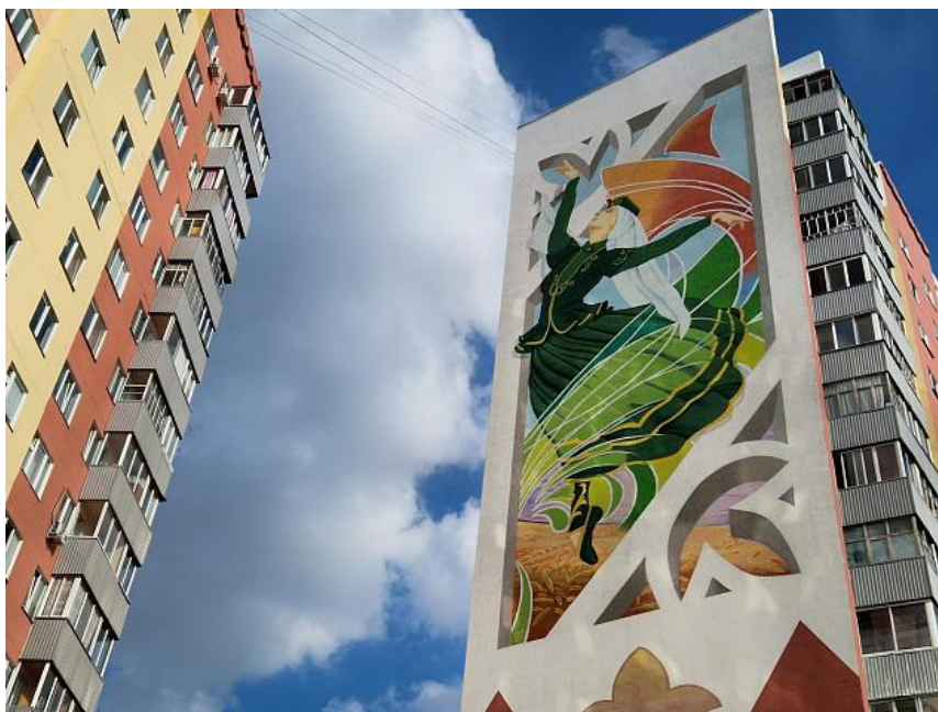
Рис. 1. «Танец царицы»

Один из крупных проектов – фасад дома 11/26. С красавицей в национальном костюме, держащей блюдо с чак-чаком, перекликается «Танец царицы» [2]. Над созданием мурала с танцующей в национальном наряде девушкой также работал Марат Билялов, граффити посвящено столетию ТАССР (рис. 1).