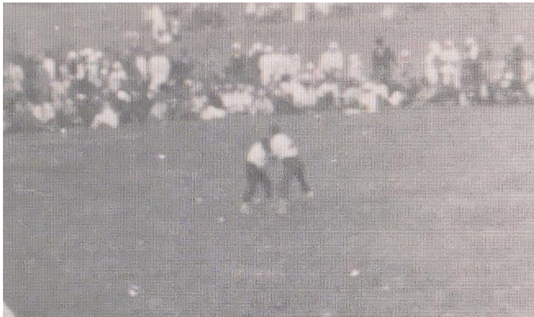
Рис. 2. (увеличенная копия рис. 1)

Для более детального просмотра момента поединка мы увеличили фотографию и обозначили её как рис. 2.