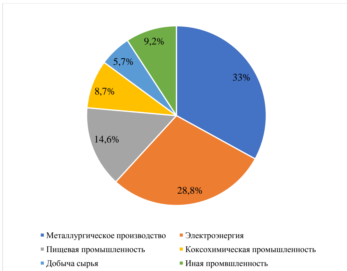
Рис. 2. Экономические показатели ДНР за 2022 г., %

Экономический потенциал Луганской Народной Республики гораздо скромнее и составляет лишь треть от экономики ДНР, но тем не менее, здесь также представлены: металлургическое производство (64,9%) и машиностроение (6,6%), весомую долю составляет пищевая промышленность (22,5%) на иные виды промышленности приходится (4%). Данные представлены на рисунке 3.