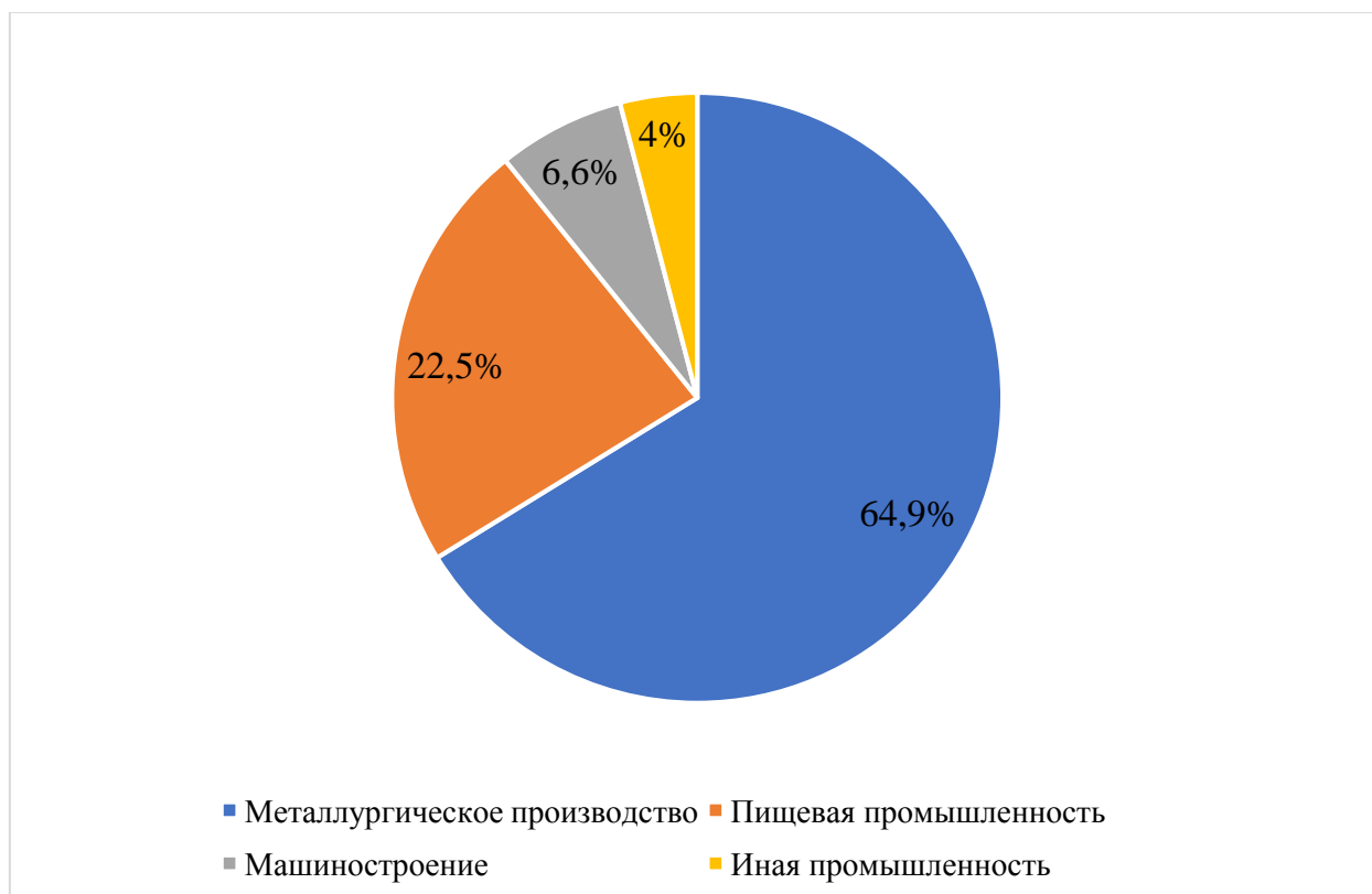
Рис. 3. Экономические показатели ЛНР за 2022 г., %

Во время проведения специальной военной операции на территории республики многие промышленные предприятия были разрушены. Особенно сильно пострадал морской порт Мариуполь, в котором располагались два крупнейших металлургических комбината региона – Мариупольский металлургический комбинат имени Ильича и металлургический комбинат «Азовсталь». Данные предприятия играли ключевую роль в сфере промышленности на территории. С их помощью производилось свыше 40% всей стали и более 55% чугуна в Украине.