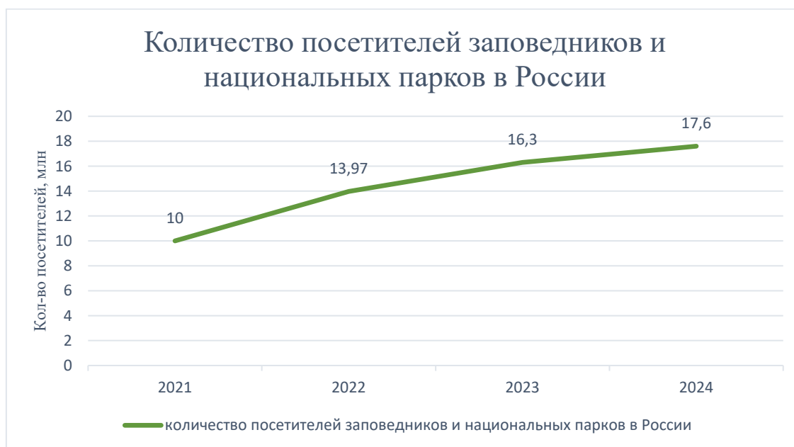
Рис. 2. Количество посетителей заповедников и национальных парков в России

На рисунке 2 представлены данные числа посетителей заповедников и национальных парков в России от ФГБУ «Росзаповедцентр».