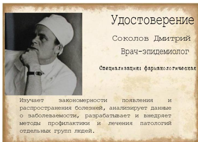
Рис. 1. Карточки героев

СССР, Министерством юстиции СССР и Генеральной прокуратурой СССР в Маньжурию для составления доказательственной базы и правильного оформления обвинительных материалов.