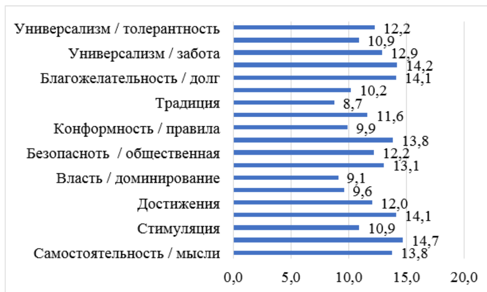
Рис. 2. Распределение ценностей людей в период зрелости (m)

Рассмотрение иерархии ценностных ориентаций мужчин в период зрелости показывает, что наиболее значимыми ценностями для них являются: самостоятельность / мысли ( m = 14,0 , SD = 2,7 ), гедонизм ( m = 14,2 , SD = 2,5 ), самостоятельность / действия ( m = 14,4 , SD = 1,6 ). Наименее значимыми ценностями для мужчин зрелости являются: традиция ( m = 7,9 , SD = 2,3 ), власть / доминирование ( m = 8,5 , SD = 3,5 ), конформность / правила ( m = 9,0 , SD = 3,3 ), власть / ресурсы ( m = 9,4 , SD = 3,6 ).