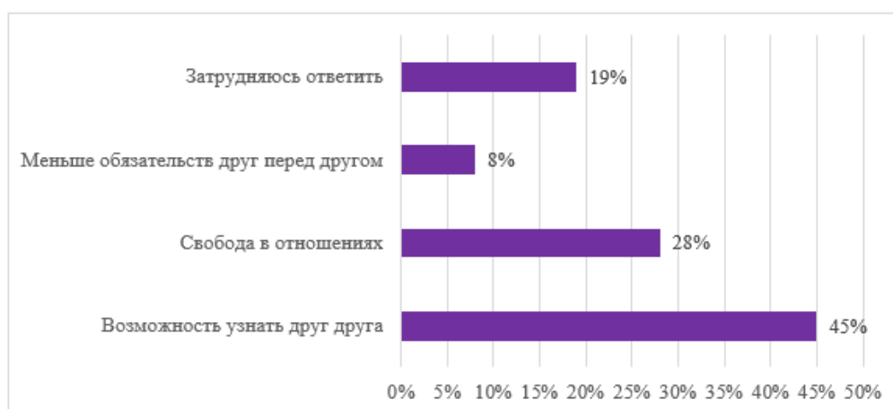
Рис. 2. Распределение ответов на вопрос «Какие преимущества незарегистрированного брака Вы видите?»

Главное преимущество сожительства отмечается и в фокус-группе. «В это время, пока мы живём со своими партнёром, мы можем узнать друг друга по-лучше, понять сходимся ли мы характерами или нет» (цитата из фокус-группы, женщина 23 года).