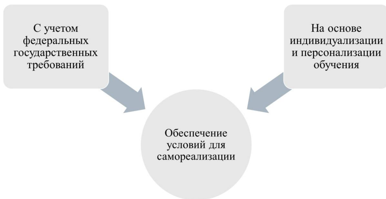
Рис. 3. Подходы к конструированию образовательных программ

Принимая во внимание цели и задачи предпрофессиональных программ [1; 5; 17], можно выделить следующие подходы к конструированию образовательных программ: