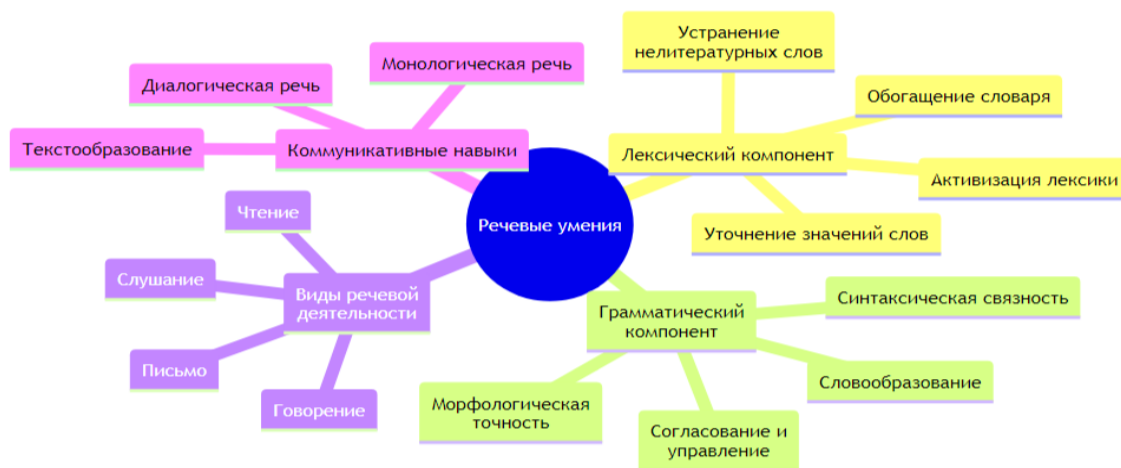
Рис. 1. Ментальная карта

Для наглядного представления взаимосвязи и иерархии этих компонентов в статье предложена ментальная карта , которая позволяет систематизировать теоретический материал и увидеть целостную структуру речевых умений.