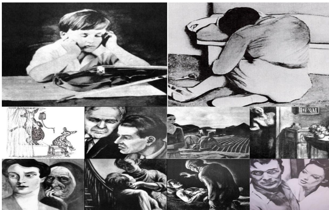
Рис. 1. Стимульные таблицы ТАТ

Это может указывать на определённые трудности в осознании и выражении собственных эмоций, что также отмечается в работах Е. Т. Соколовой [7].