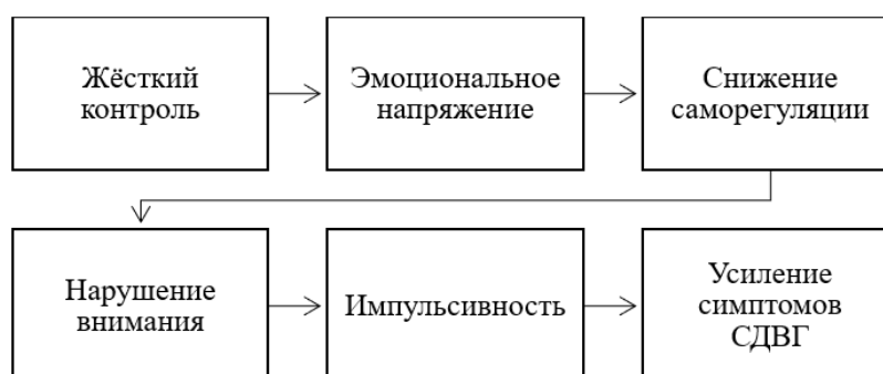
Рис. 3. Влияние жёстких педагогических стратегий на проявления СДВГ

Особую значимость проблема приобретает в контексте детей с синдромом дефицита внимания и гиперактивности. По Б.В. Воронкову, СДВГ характеризуется нарушением внимания, импульсивностью и гиперактивностью [1]. Жёсткие педагогические стратегии могут усиливать проявления данного синдрома, поскольку повышают уровень стресса и снижают возможности саморегуляции. Влияние жёсткой педагогической стратегии на развитие симптомов СДВГ наглядно представлено на рисунке 3.