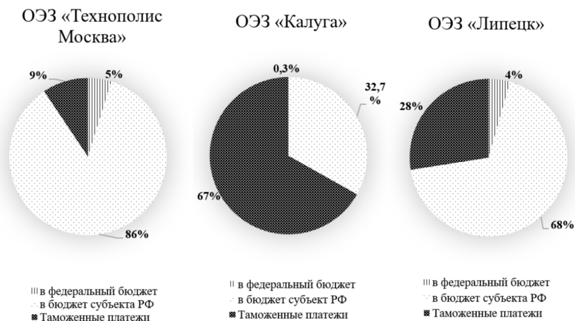
Рис. 2. Объем налоговых льгот ОЭЗ «Технополис Москва», ОЭЗ «Калуга», ОЭЗ «Липецк» по различным видам бюджета в 2023 г., в %

Главным преимуществом ОЭЗ являются налоговые льготы, предоставленные компаниям-резидентам. На рисунке 2 представлено распределение налоговых льгот резидентов самых крупных ОЭЗ в Центральном федеральном округе (ОЭЗ «Технополис Москва», ОЭЗ «Калуга», ОЭЗ «Липецк») по различным видам бюджета.