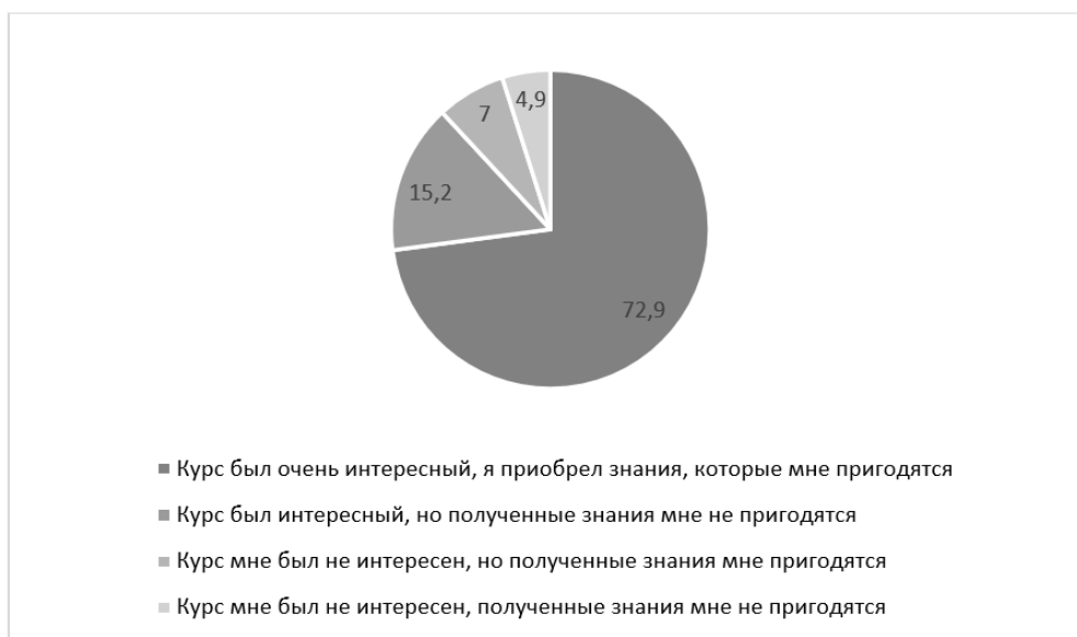
Рис. 1. Оценка студентами полезности курса

Важным критерием успешности является то, что студенты будут применять в своей жизни знания, которые получили на данном курсе (рис. 1). Положительную оценку образовательной ценности курса дали 75% ответивших.