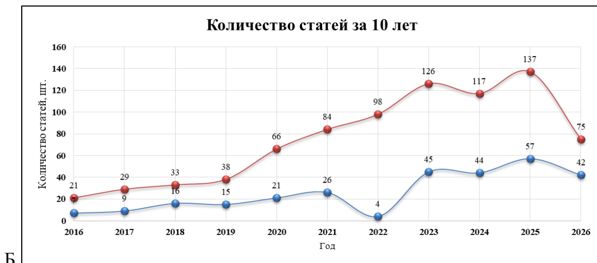
Рис. 1. Статистический анализ публикационной активности в базе данных PubMed за 10 лет (2016–2026 гг.) при использовании комбинации ключевых слов « bioprinting and skin » («биопечать и кожа»). А – фото с поисковой страницы. Б – точечная диаграмма динамики статей по данным результата поиска (красная линия все опубликованные работы, синяя – обзоры)

Если проанализировать общую тенденцию, то можно заметить, что с 2016 по 2019 год количество публикаций в области биопечати кожи увеличилось в 1,8 раз, далее с 2020 по 2023 года увеличилось еще в 1,9 раз. После 2023 года такого бурного удвоения количества статей не наблюдается.