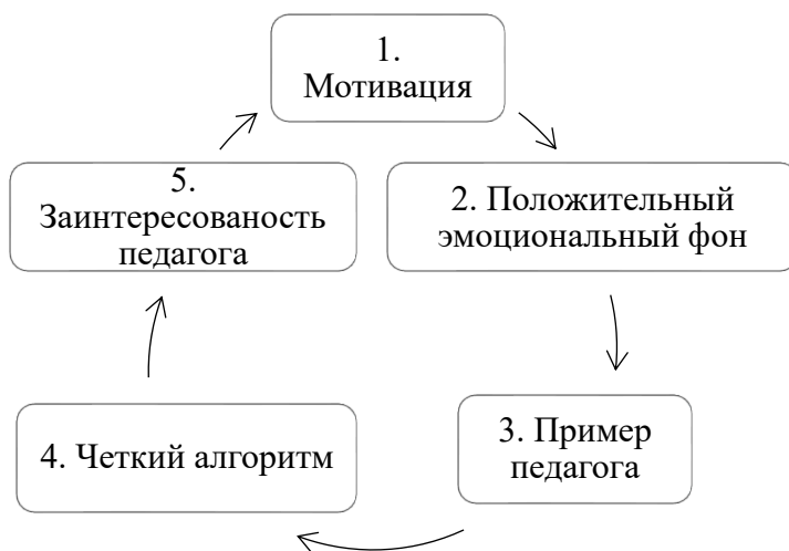
Рис. 2. Принципы работы при подготовке младшего школьника к публичному выступлению на конкурсе

качественной подготовке обучающийся должен уметь правильно презентовать свой доклад (стихотворение и т. п.) и владеть содержательной частью: отвечать на вопросы по содержанию своего выступления.