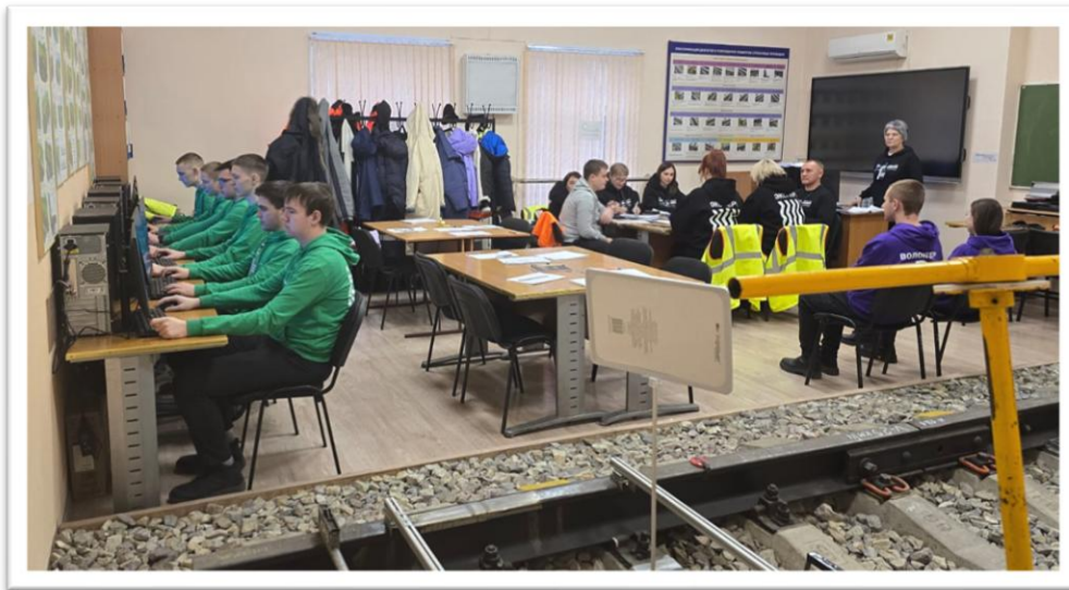
Рис. 6. Комната участников, экспертов, главного эксперта

Комната участников, экспертов, главного эксперта находилась за пределами конкурсной площадки, но в шаговой доступности к полигонам стрелочного перевода и участка железнодорожного пути.