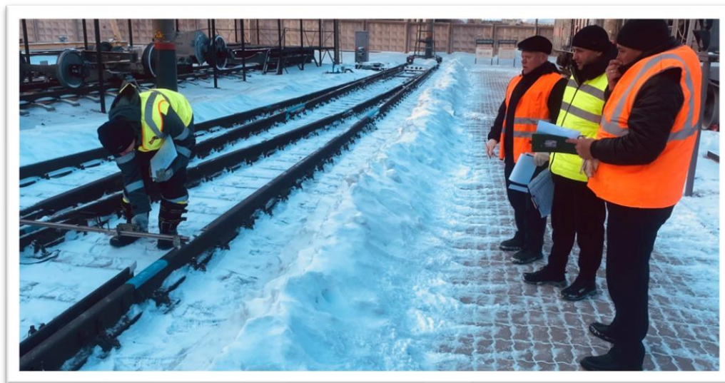
Рис. 7. Полигон стрелочного перевода 2026 год

Конкурсанты два дня из трех проводили на полигоне в условиях, максимально приближенных к настоящей деятельности рабочих сети железных дорог, выполняли измерительные работы на прямом участке железнодорожного пути и на стрелочном переводе. Каждый день соревнований начинался с подготовки пути к промерам. Как и положено, путейцы с утра чистили путь от снега, а затем выполняли поставленные перед ними конкурсные задачи.