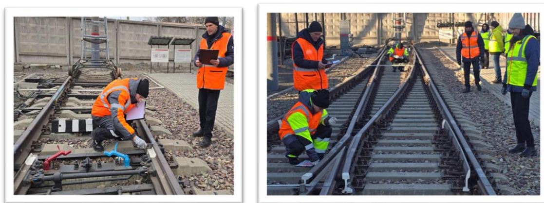
Рис. 5. Полигон стрелочного перевода 2025 год

Для организации и проведения этапа Регионального Чемпионата руководство учебного центра предоставило технически оснащенное помещение, полигоны, соответствующие требованиям плана застройки. Согласно инфраструктурному листу, Уссурийская дистанция пути обеспечила конкурсантов измерительными приборами и спецодеждой.