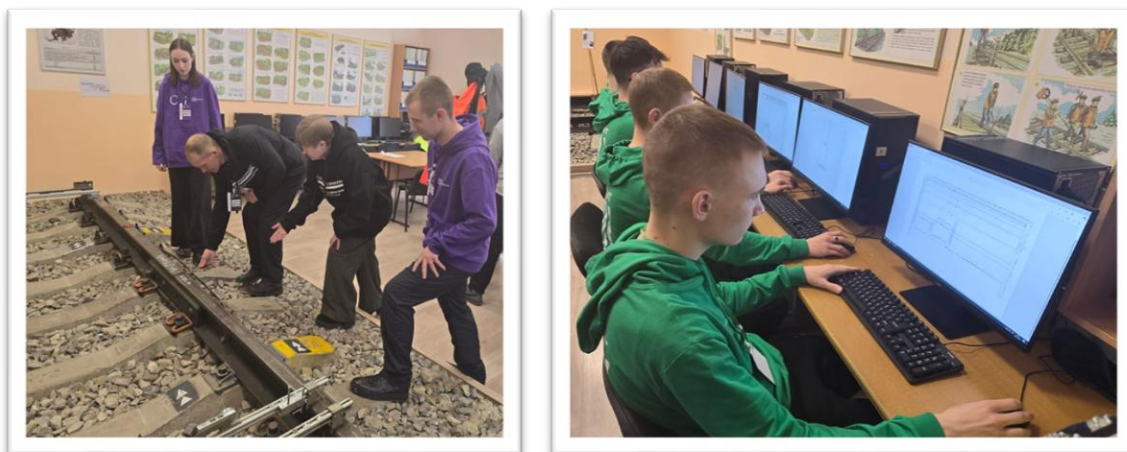
Рис. 4. Рабочие места конкурсантов

пути» среди участников основной возрастной линейки регионального этапа Чемпионата «Профессионалы» вот уже второй год, проходили на площадке Дальневосточного учебного центра профессиональных квалификаций в г. Уссурийске – структурного подразделения Дальневосточной железной дороги [2].