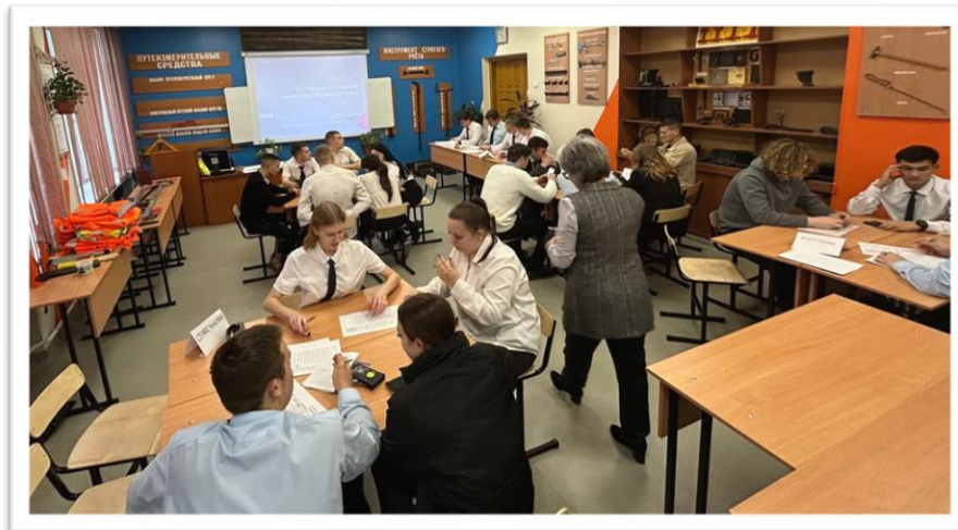
Рис. 1. Отборочный тур среди студентов 3 курса

сты, которые обладают высокими практическими навыками, ведь она связана, в том числе и с безопасностью пассажиров.