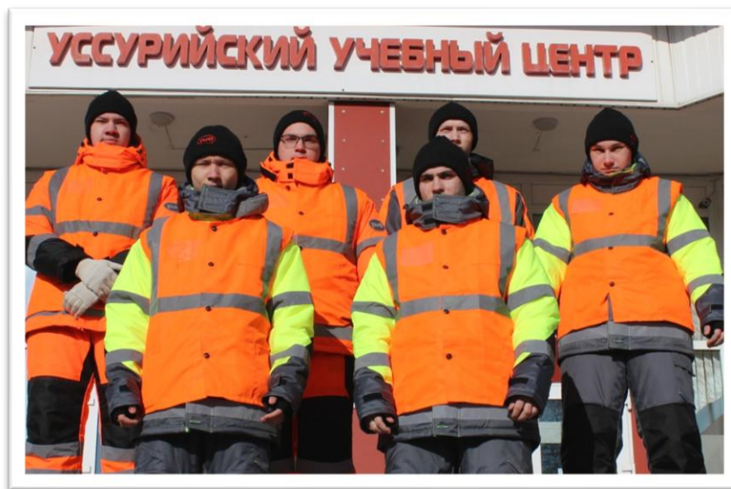
Рис. 3. База проведения Регионального этапа Чемпионата

Средний балл участников внутреннего отбора 2025 года составил 39,4, а в 2026 году – 51,5 балла. Это значит, что с годами конкурсанты, более подготовлены и заинтересованы в получении профессиональных навыков.