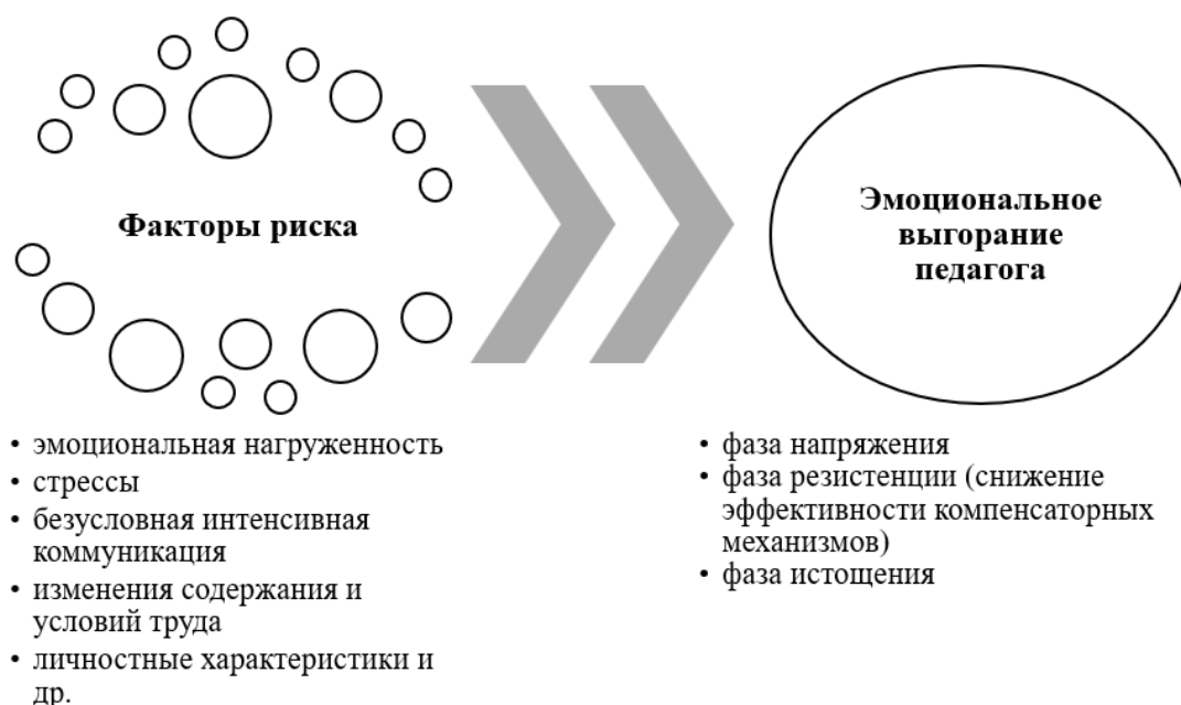
Рис. 1. Факторы риска, влияющие на развитие эмоционального выгорания у педагогов

В числе ключевых факторов развития выгорания разные авторы называют эмоциональную нагруженность педагогов, высокую стрессогенность деятельности. Факторы риска и эмоционального выгорания педагогов отражены на рисунке 1.