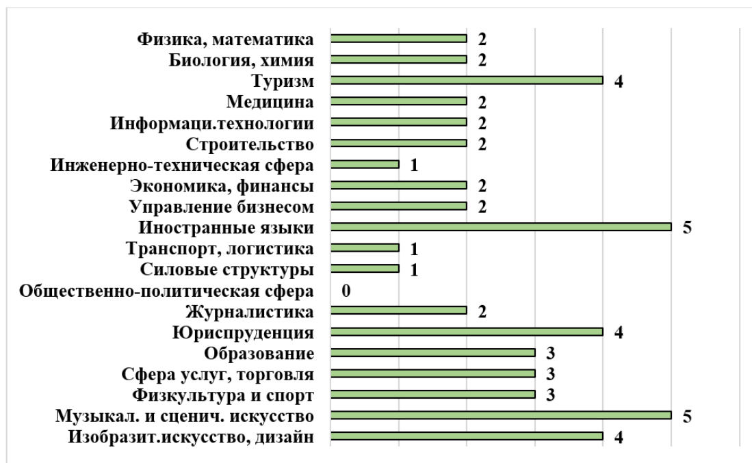
Рис. 2. Выраженный интерес по результатам методики «Карта интересов»

Результаты по методике «Карта интересов» представлены на рисунке 2.