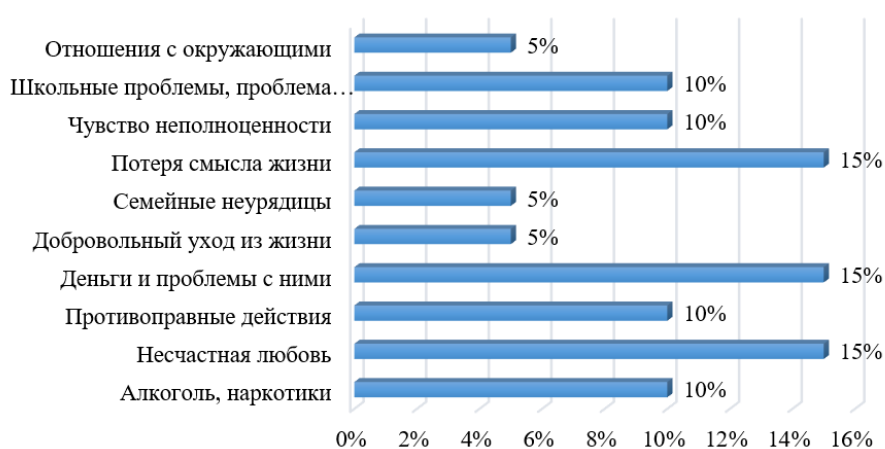
Рис. 2. Результаты первичной диагностики подростков по методике тестирования выявления суицидального риска у детей А.А. Кучер, В.П. Костюкевич

Исходя из рисунка, можно сделать вывод, что суицидальный риск присутствует у одного ребенка из 20 человек. При этом можно утверждать, что имеется необходимость проведения профилактических бесед с подростками о важности жизни, а также, возможно, проведение уроков по формированию навыков преодоления трудностей и рационального реагирования на стресс.