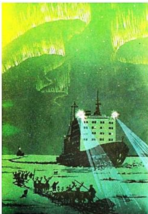
Рис. 6. В.И. Мешков. В низовьях Енисея

Очень важно, чтобы выдающиеся, известные люди в стране – артисты, спортсмены, предприниматели – поддерживали своей заботой имеющиеся пока в стране детские дома и приюты, чтобы дети никогда не знали насилия, чтобы они с радостью раскрывались любящим сердцам, идущим к ним с заботой и поддержкой.