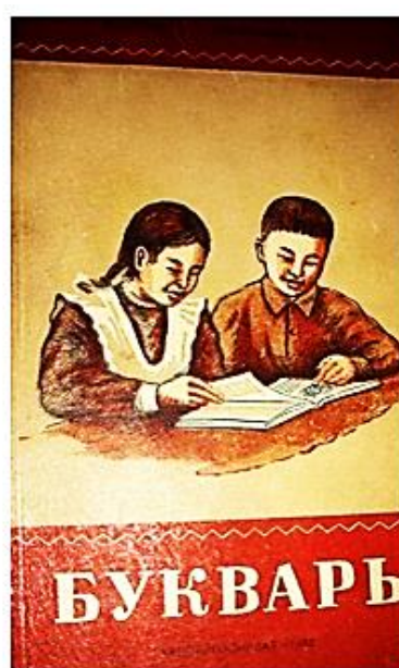
Рис. 1. Первый букварь на хакасском языке (1952).