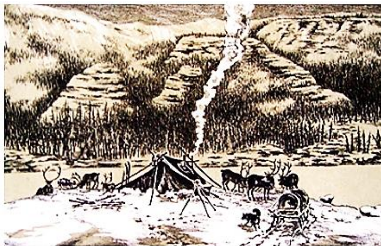
Рис. 3. В гостях у геологов

Будничны, но в то же время величественны картины, запечатлённые художником. До самого неба поднимаются незыблемые, могучие в своей первозданности горы Путорана. Непременные олени, как символ Севера. И маленький ярко-красный самолетик как ещё одна веха путешествующих по суровым северным дорогам ( https://the-morning-spb.livejournal.com/23605.html ; https://museumsrussian.blogspot.ru/2013/01/5.html?m=1 ).