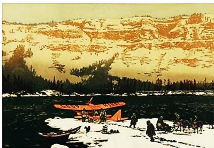
Рис. 2. В горах Путорана. 1958

«В эвенкийской серии гравюр Мешкова переплелись Эвенкия старая и Эвенкия новая. Бесконечные просторы тундры, глубокие снега, по которым едва пробираются олени упряжки, еще не тронутая тайга с дикими оленями, большой аргиш, отправляющийся в неведомое, – как рвется сердце за этим караваном в бескрайнее и непознанное, к горизонту, затерявшемуся в снегах. А рядом с этим поселки с добротными домами, вертикалями радиомачт, вездесущие «Аннушки» и вертолеты.