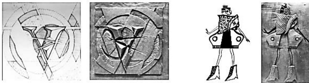
Рис. 1. Работы студентов 3 курса

Для лепки этюда с натуры, предварительные эскизные зарисовки с различных видовых точек дают более глубокий анализ модели. Обычно при первом восприятии постановки студент еще не знает особенностей ее строения, не чувствует ее существенных характеристик, не представляет наиболее оптимальных средств выражения. С помощью зарисовок обращается внимание на характерные пропорциональные, анатомические, пластические особенности модели. Важно заставить студентов мыслить аналитически, а не слепо следуя натуре. Благодаря этому скульптурный этюд получается более выверенным и точным, а у студентов формируется умение показать в этюде особенности наблюдаемой модели объемно-пространственными средствами. Наблюдение за натурой призвано сформировать у студентов способности выстраивать некоторые аналогии и закономерности развития формы, с целью дальнейшего их применения в последующих работах.