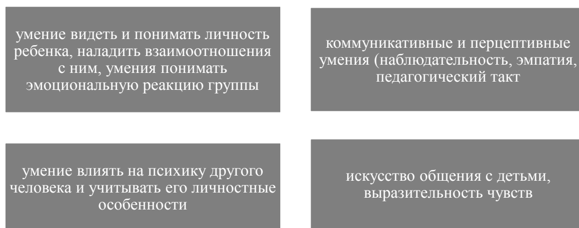
Рис. 3. Слагаемые педагогической техники

Согласно мнению выше обозначенных авторов, педагогическая техника является как компонентом педагогического мастерства, так и компонентом педагогической компетентности и рассматривается как комплекс общепедагогических и психологических умений педагога, обеспечивающих владение им собственными психофизическими состояниями, настроением, эмоциями, телом, речью для организации педагогически эффективного общения. К важным умениям педагогической техники ученые относят следующие (рисунок 3).