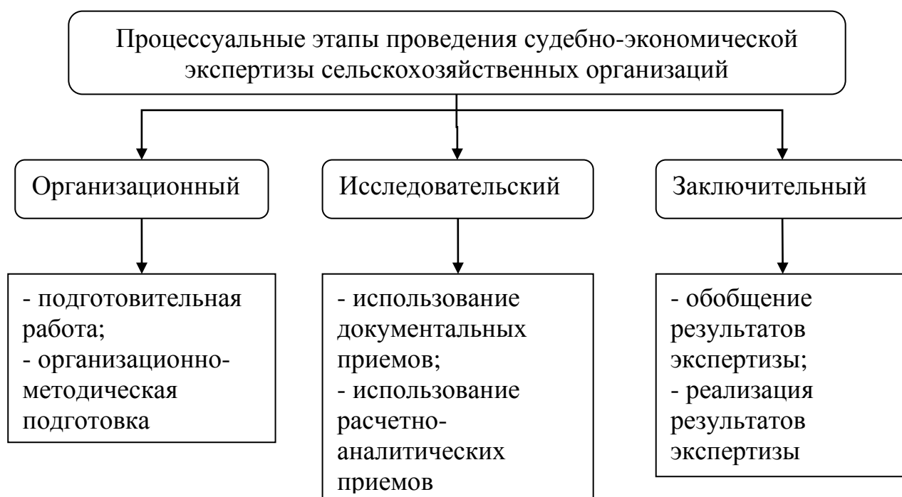
Рис. 1. Процессуальные этапы проведения судебно-экономической экспертизы сельскохозяйственных организаций

Если рассматривать методы и процедуры судебной экономической экспертизы сельскохозяйственных организаций, в том числе в области затрат, то она включает в себя следующие составляющие. Представим наглядно на рисунке 2.