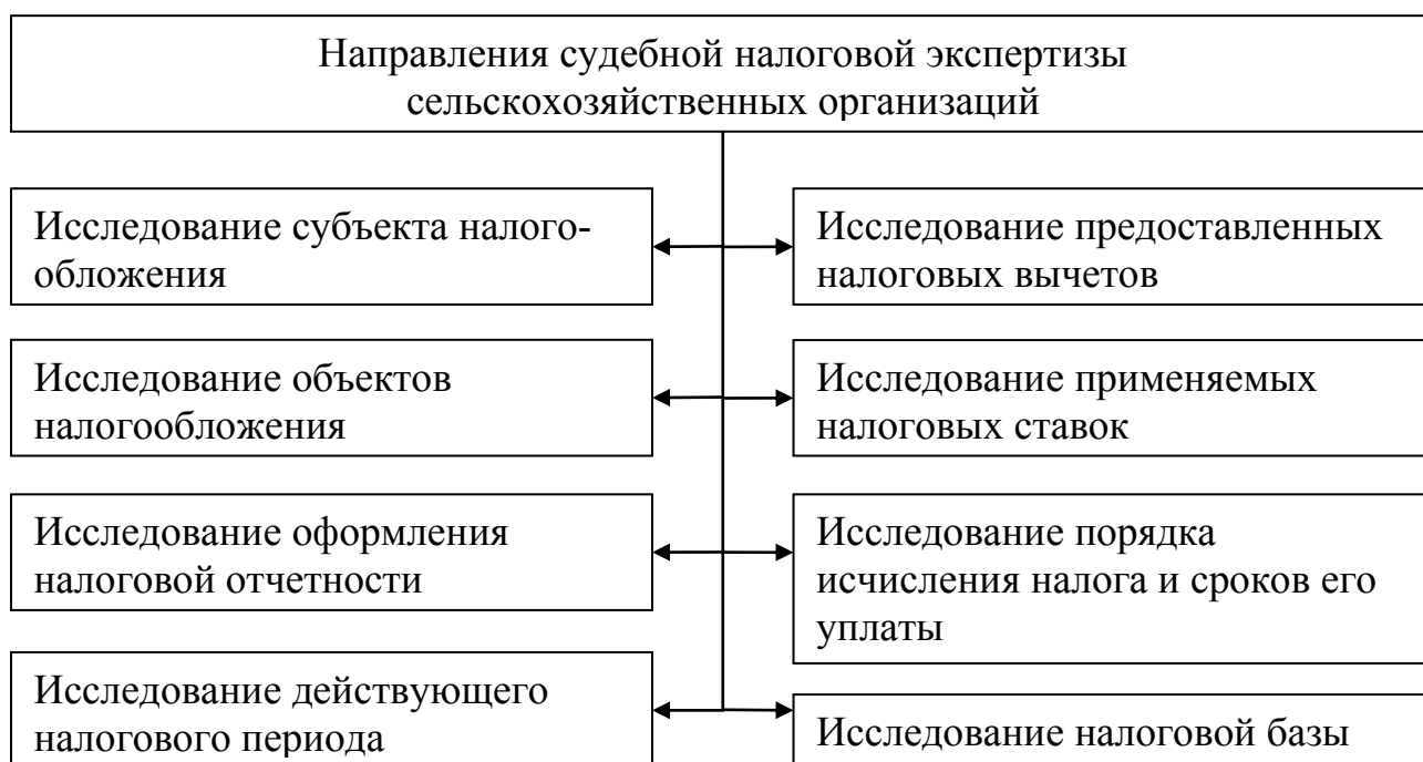
Рис. 3. Направления судебной налоговой экспертизы сельскохозяйственных организаций

Отличия судебной экономической экспертизы сельскохозяйственных организаций, в частности затрат предприятия, определяют процесс ее проведения.