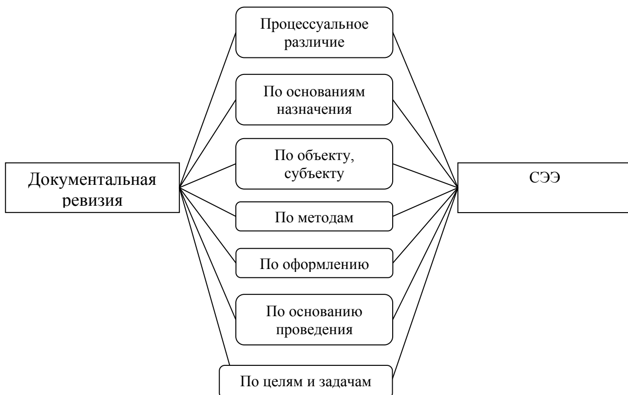
Рис. 4. Различие судебной экономической экспертизы сельскохозяйственных организаций с документальной ревизией

Можно сделать вывод, что судебная экономическая экспертиза сельскохозяйственных организаций во многом схожа с предприятиями остальных отраслей. Она также определена основными этапами, методами и процедурами, направлениями судебной налоговой экспертизы, отличиями судебной экономической экспертизы сельскохозяйственных организаций в области затрат.