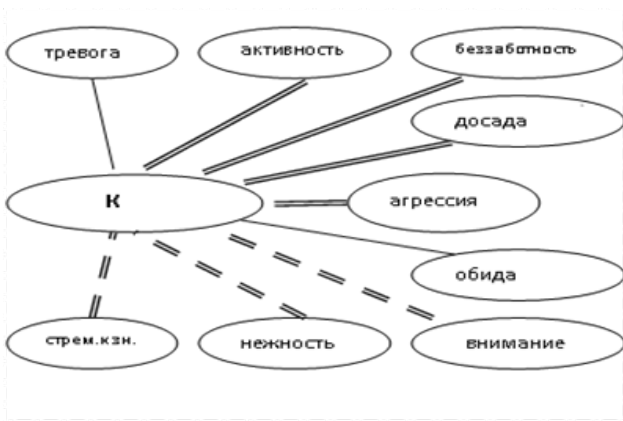
Рис. 2. Взаимосвязь психических состояний дошкольников со статусной характеристикой «активные, конфликтные»