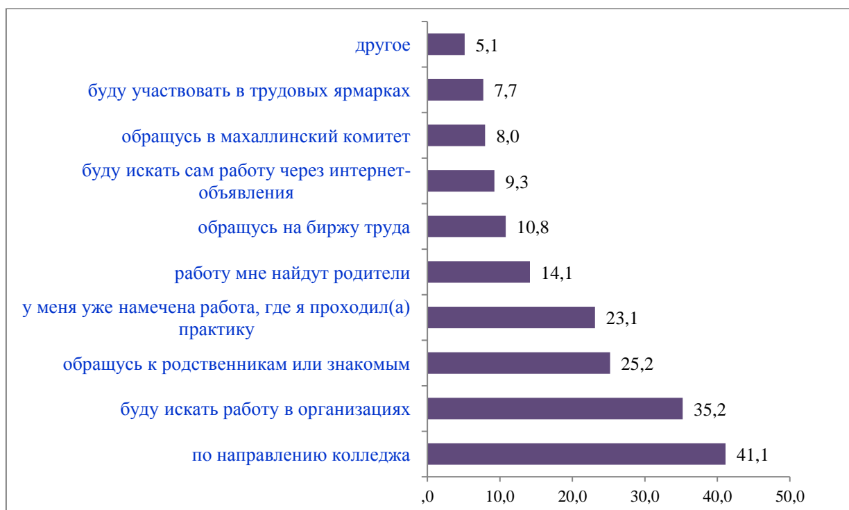
Рис. 2. Намерения молодежи по трудоустройству (результаты обследования, %)

Заслуживают внимания ответы молодых людей о желании организовать свой бизнес (9,2%). Среди девушек предпочтения в разрезе отраслей экономики отданы образованию (30,0%), банковско-финансовому сектору (17,2%), здравоохранению (13,6%), промышленности (6,2%), открытию своего бизнеса (10,6%). Мнения молодежи о путях и формах трудоустройства после завершения учебы разнообразны (рис. 2).