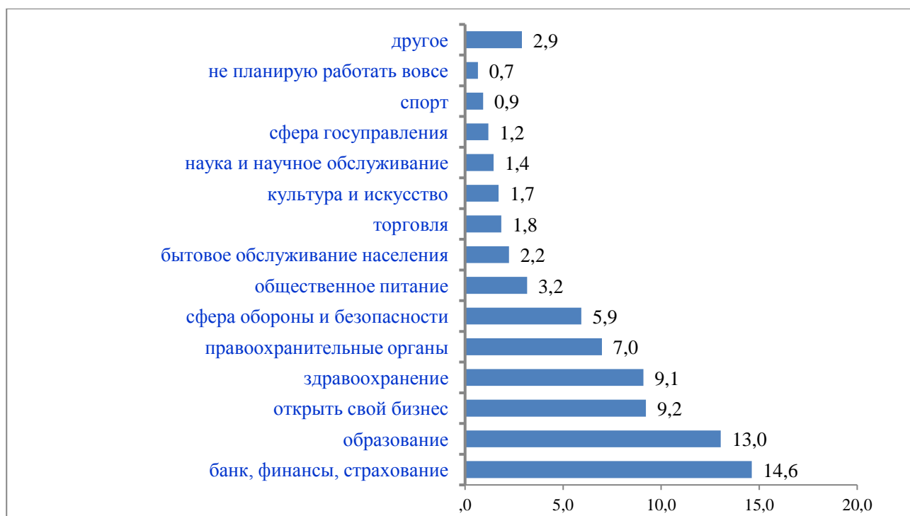
Рис. 1. Предпочтения молодежи работать в отдельных отраслях экономики (результаты обследования, %)

Важными представляются ответы на вопросы о предпочтениях молодежи в выборе места работы в разрезе отраслей экономики (рис. 1).