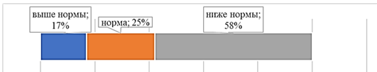
Рис. 2. Процентное соотношение первоклассников с различными показателями продуктивности памяти на констатирующем этапе эксперимента

Процентное соотношение первоклассников с различными показателями продуктивности памяти на констатирующем этапе эксперимента представлено на рис. 2.