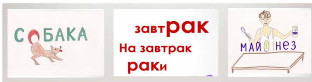
Рис. 3. Примеры ассоциативного запоминания трудных для написания слов

Одним из основных методов запоминания стал метод ассоциаций.