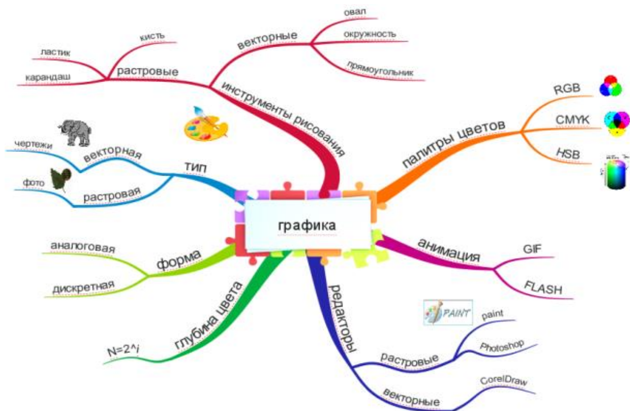
Рис. 2. Ментальная карта «Компьютерная графика»

При более глубоком рассмотрении программного обеспечения, которое реализуется в рамках изучения других разделов, в частности, посвященных технологиям создания и обработки текстовой, графической, табличной и других видов информации средствами прикладных программных продуктов, можно использовать ментальную карту (рис. 2).