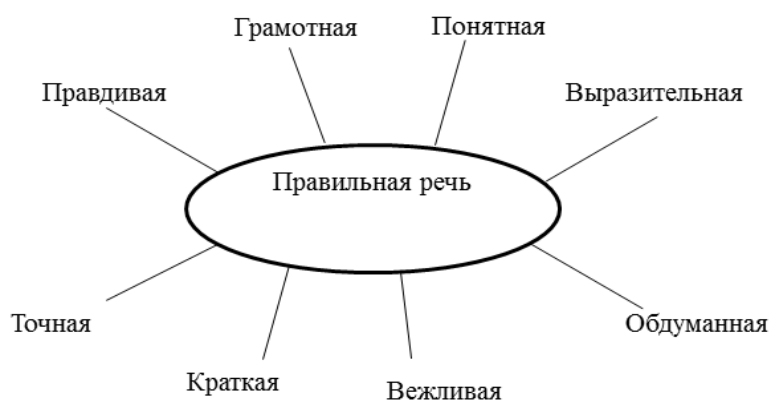
Рис. 1. Методическое обоснование результатов фрагмента 1

Сначала проводим игры на командообразование: «Снежный ком», «Фруктовый микс», «Каскад приветствий», «Невербальное знакомство», «Построиться по ...». Эти игры-упражнения помогают лучше узнать друг друга, установить эффективные коммуникации. В результате повышается уровень доверия, работоспособности, осмысленности целей занятия [4, с. 25].