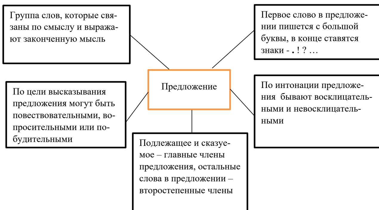
Рис. 3. Методическое обоснование результатов фрагмента 3

4) составление кластера по итогам групповой работы.