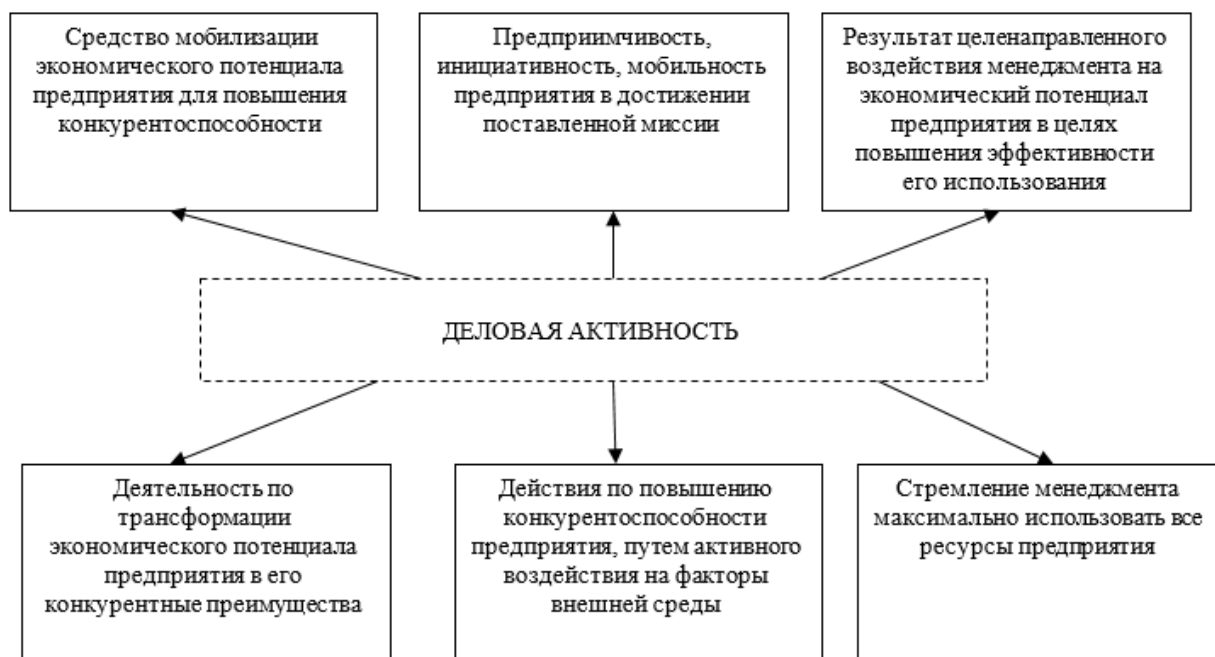
Рис. 1. Научные взгляды на деловую активность предприятия

Проведенный анализ позволяет говорить о неоднозначности понятия деловая активность, что связано со сложностью и многоаспектностью рассматриваемого термина.