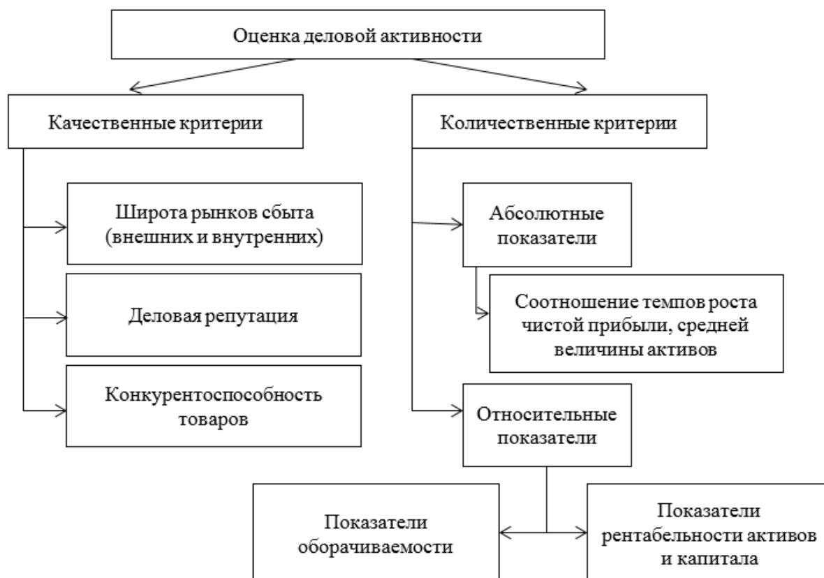
Рис. 3. Методика оценки деловой активности предприятия

По качественным критериям исследуются такие параметры, как широта рынков реализации продукции, деловая репутация предприятия и потребителей, пользующихся предложениями фирмы, конкурентоспособность предлагаемой продукции [11, с. 43].