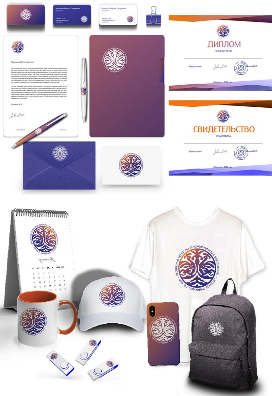
Рис. 4. Дизайн-предложение по использованию логотипа на носителях фирменного стиля. Студенческая работа.