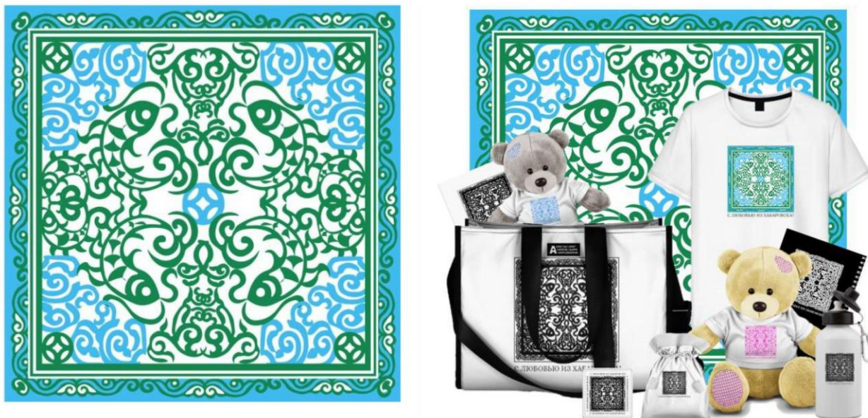
Рис. 1. Цифровая реконструкция орнаментальных мотивов.