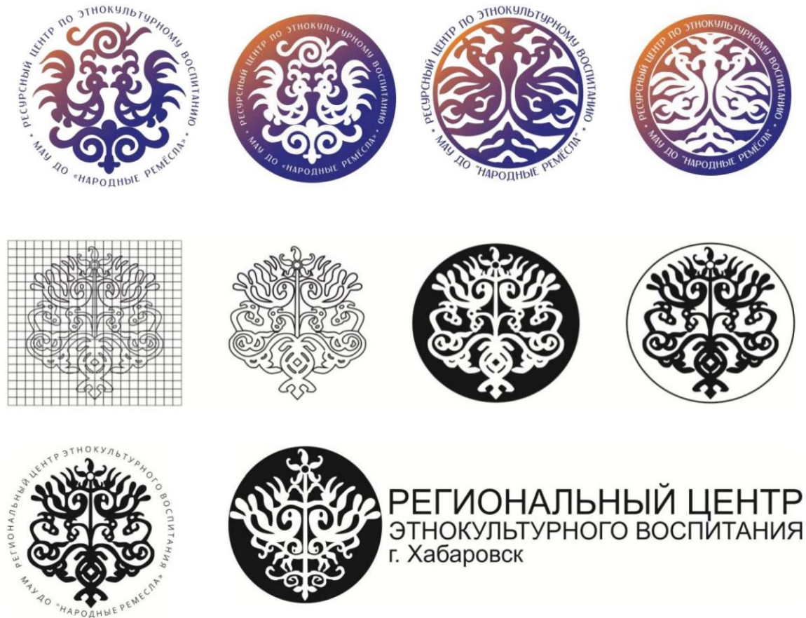
Рис. 3. Варианты дизайна логотипа для регионального центра этнокультурного воспитания детей и молодежи при МАУ ДО «Народные промыслы» на основе графической и цифровой реконструкции и орнаментального мотива «Родовое Древо». Студенческая работа.

ки Регионального центра этнокультурного образования и сопутствующей сувенирной продукции (рис. 3, 4).