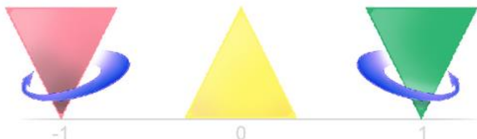
Рис. 2. Пирамида и две разновидности волчка на шкале зарядов

Теперь рассмотрим систему зарядов, вспомнив, что если на шкале есть «+ 1», то должна быть и позиция «- 1». Часто на занятиях и семинарах интересуюсь, мотивируя студентов и слушателей на образное мышление, какую фигуру в полную противоположность и пирамиде и волчку в точке «+ 1», можно представить на другом конце шкалы, в точке «- 1»? За семь лет услышал самые разные варианты и предположения: от шара и квадрата до очень схожих с авторской концепцией – волчка, но перевернутого и размещенного под полем ресурсов (под землей). Но все гораздо проще. У мертвой пирамиды есть вторая разновидность волчка (рис. 2).