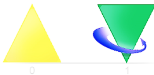
Рис. 1. Пирамида и волчок – две позиции на шкале

Теперь рассмотрим систему зарядов, вспомнив, что если на шкале есть «+ 1», то должна быть и позиция «- 1». Часто на занятиях и семинарах интересуюсь, мотивируя студентов и слушателей на образное мышление, какую фигуру в полную противоположность и пирамиде и волчку в точке «+ 1», можно представить на другом конце шкалы, в точке «- 1»? За семь лет услышал самые разные варианты и предположения: от шара и квадрата до очень схожих с авторской концепцией – волчка, но перевернутого и размещенного под полем ресурсов (под землей). Но все гораздо проще. У мертвой пирамиды есть вторая разновидность волчка (рис. 2).