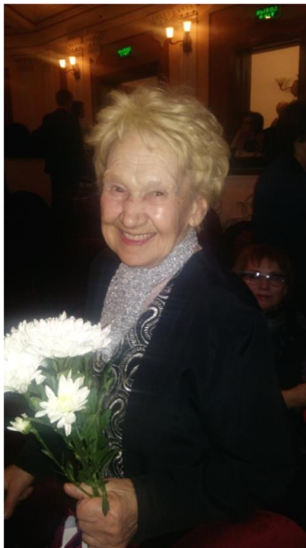
Фото 6. Первый специалист с высшим музыкальным образованием приехала на Урал по распределению в ПМУ и прошла путь от педагога до заведующей ДХО (1949–1975). В 2000-е гг. педагогом-совместителем по дирижированию на эстрадном отделении