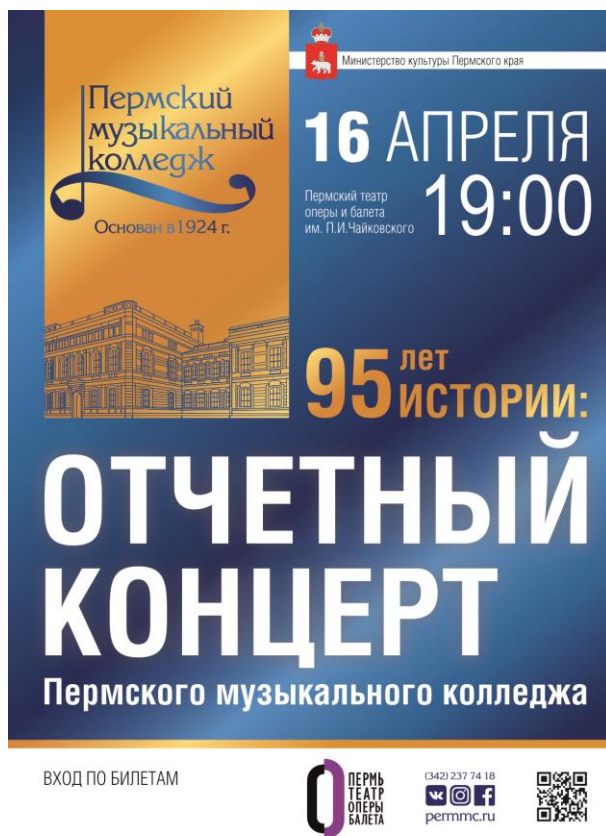
Фото 3. Афиша

Кстати, сайт с новым оформлением, с планом концертов на месяц, вперед, а это удобно. Знаешь четко, во сколько и когда проходит то или иное тебя интересующее мероприятие.