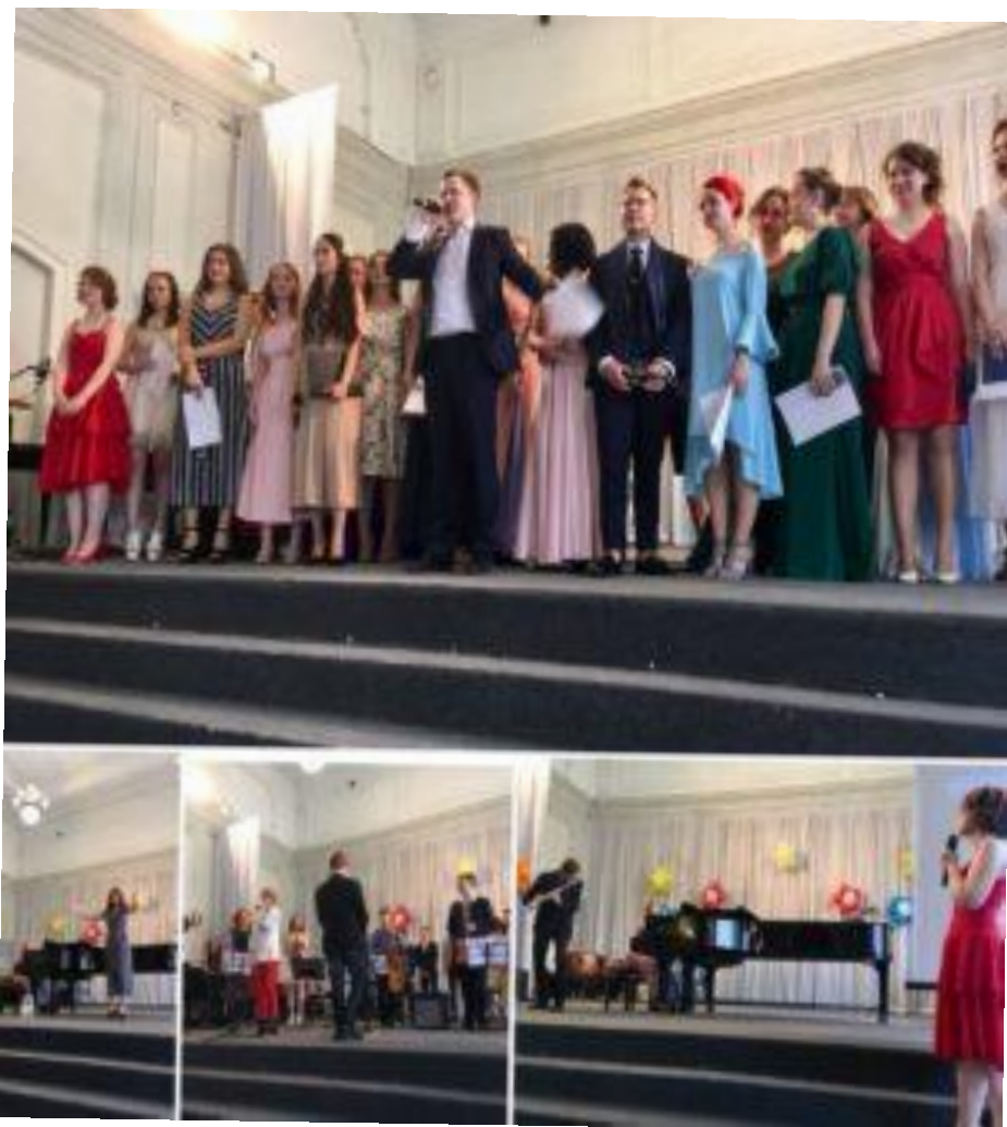
Фотоколлаж 8. Выпускной 2018

Была перевернута еще одна страница и начал отсчет к 100-летию (2024) (коллаж 8 Н. Чунтомова). Таким образом, продолжение в скором времени будет иметь дальнейшее развитие. В добрый путь, учащиеся и педагоги! История продолжается.