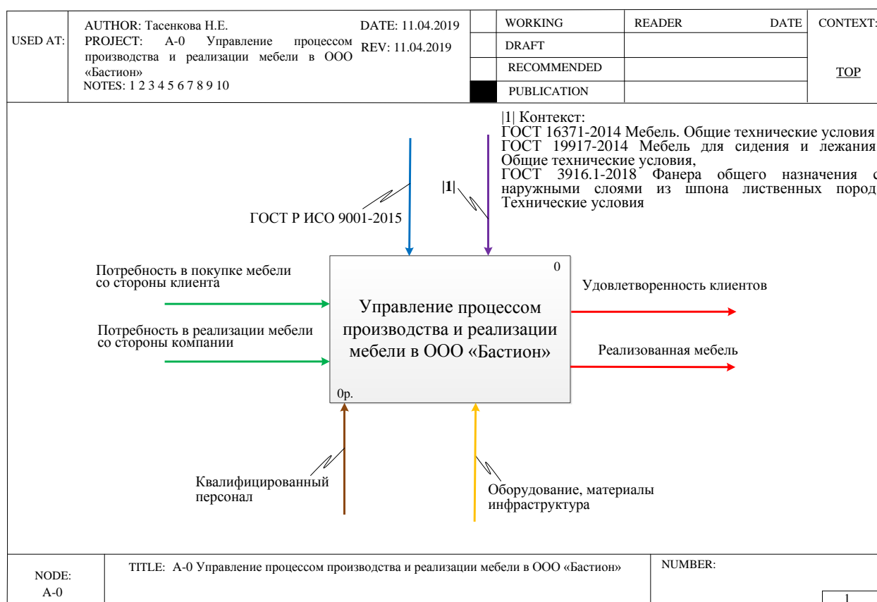
Рис. 1. Контекстная диаграмма процесса производства и реализации мебели в ООО «Бастион»

территории Владимирской области, использовался подход, выражающийся IDEF0 диаграммами. При использовании для построения СМК данного метода модель строится из диаграмм, фрагментов текстов, связанных с производственной деятельностью, и глоссария, все компоненты имеют ссылки друг на друга рис. 1. Основным процессом, тесно связанном с потребителем, является процесс производства и реализации мебели. Большая часть мебели предприятием производится по ГОСТу, использование государственного стандарта вызывает у потребителя больше доверия к продукции по сравнению с производством по техническим условиям (ТУ) и стандартам предприятия (СТП).