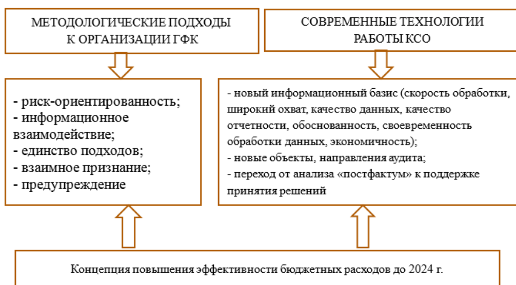
Рис. 2. Вектор развития государственного финансового контроля

Необходимо отметить важность качества организации управленческого процесса и организации работы проектных офисов от федерального уровня до уровня региона в ходе реализации национальных проектов. По нашему мнению, национальные проекты, с одной стороны, позволят задействовать управленческие и ресурсные возможности повышения социально-экономического развития страны и региона [2, с. 97], а с другой стороны, являются новым объектом государственного финансового контроля [3, с. 206].