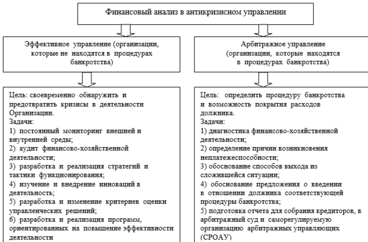
Рис. 2. Цели и задачи проведения финансового анализа в антикризисном управлении

Понятие «антикризисное управление» можно разделить на две составляющие: «эффективное управление» для организаций, которые не находятся в процедурах банкротства, и «арбитражное управление», где финансовый анализ проводится в процедурах дела о банкротстве (рис. 2).