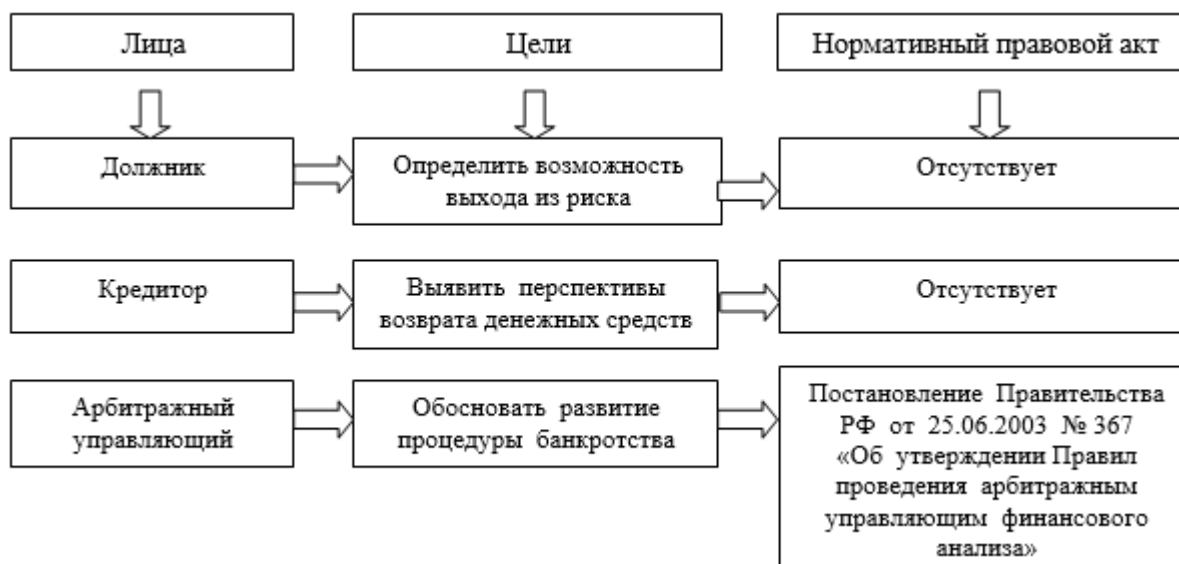
Рис. 1. Цели финансового анализа в арбитражном управлении

ными особенностями арбитражного управления как части антикризисного управления являются: принятие решений в сжатые сроки, условия социальной напряженности, отсутствие необходимой информации и финансовых ресурсов (рис. 1).