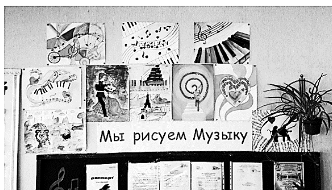
Рис. 1. Выставка из рисунков учащихся «Мы рисуем музыку»

Со второго класса уже предлагаю ребенку найти информацию о композиторе, произведение которого мы проходим. В своем классе мы с детьми оформили специальную выставку рисунков на тему «Мы рисуем музыку». Эта выставка постоянно пополняется новыми работами. Все это вызывает интерес к учебе.