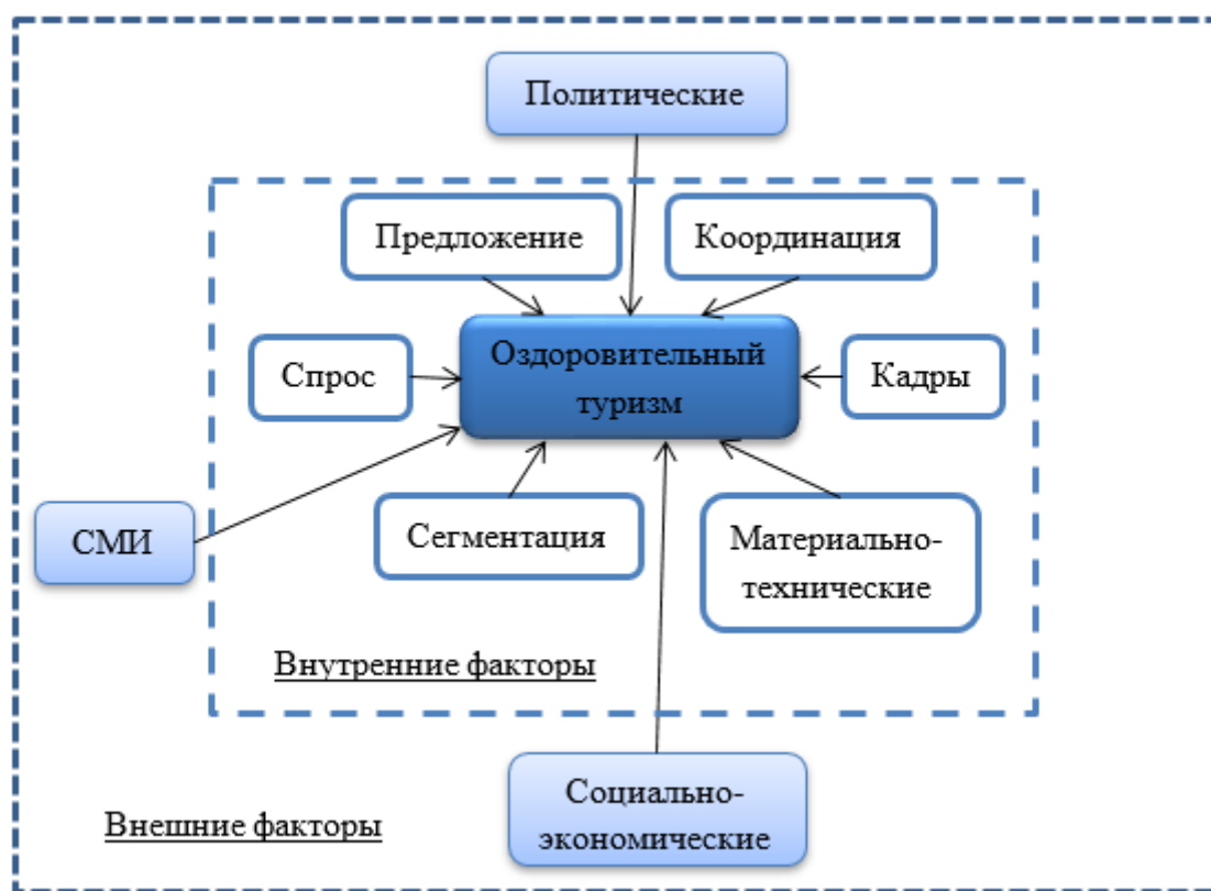
Рис. 3. Специфические внешние и внутренние факторы, влияющие на формирование оздоровительно-туристического сегмента в России

ние клиента получать услуги в разных странах для того, чтобы совместить процедуру оздоровления с процедурой познания. Уровень духовных потребностей формирует мотивацию к оздоровлению, к профилактике различных заболеваний.