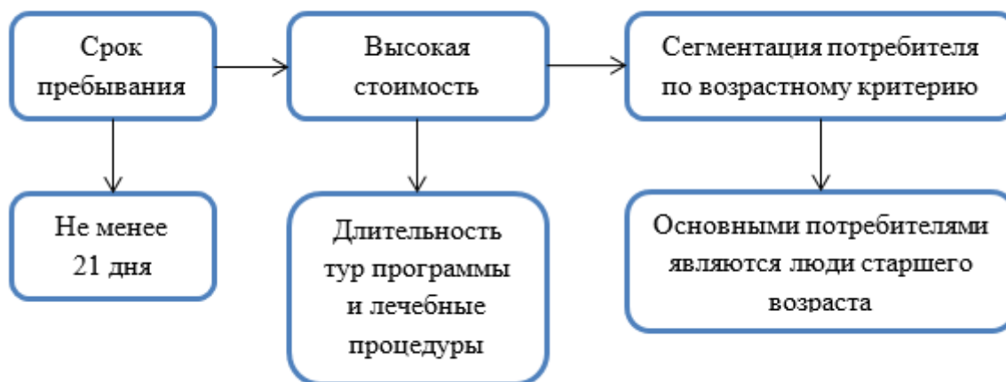
Рис. 1. Характерные особенности оздоровительно-туристического сегмента

Таким образом, особенности формирования туристического сегмента в России обусловлены в первую очередь характерными особенностями оздоровительно-туристического сегмента, то есть одним из основных факторов, влияющих на оздоровительный туризм в России является стоимость, которая напрямую зависит от длительности пребывания, программы оздоровления и уровня комфорта условий отдыха, следовательно, темпы его развития зависят от уровня жизни населения. Такие факторы, как комфортабельные условия, оказывают влияние на количество иностранных туристов, поскольку стоимостной фактор для клиентов из развитых стран не является наиболее значимым. Особым условием формирования сегмента оздоровительного туризма является организация отдыха с учетом возрастных групп клиентов. Также при оказании услуг важна медицинская информация о клиенте, поскольку основной целью пребывания является не отдых и развлечения, как в обычном туризме, а лечение и оздоровление. В связи с этим для достижения клиентом положительного эффекта от оказанных туристических услуг обязательным является получение медицинской информации [4].