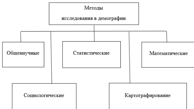
Рис. 1. Методы исследования в демографии

В связи с этим существенный научный интерес представляет вопрос обращения к методическому инструментарию изучения социально-демографических процессов. Современная демография нацелена на получение точных сведений на основе статистических, математических, социологических и картографических методов. К неотъемлемым способам познания действительности относятся использование различных общенаучных методов, в частности анализа, синтеза, дедукции, индукции и т.д. (см. рис. 1).