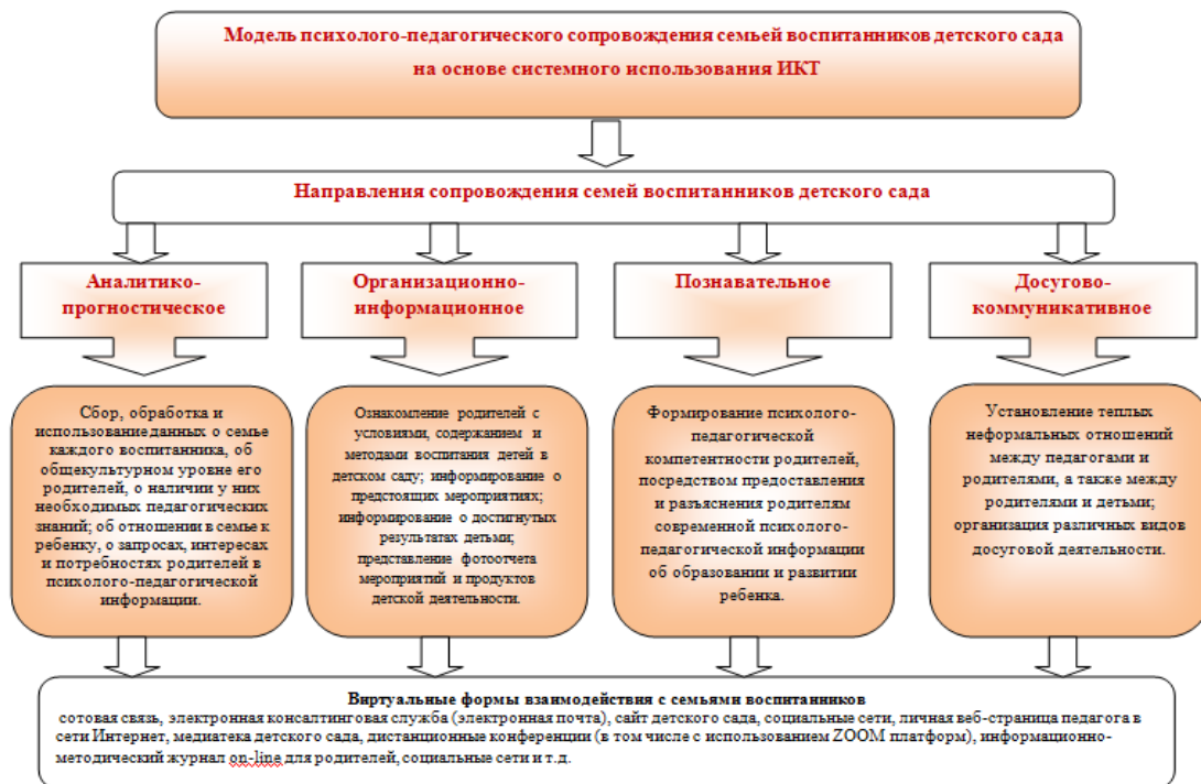
Рис. 1. Модель психолого-педагогического сопровождения семей воспитанников детского сада на основе системного использования ИКТ