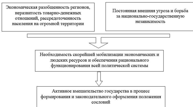
Рис. 8. Основные причины и особенности формирования сословной организации в России

В эпоху петровских преобразований была создана военно-бюрократическая социальная система, в основе которой лежала иерархичность и соподчинённость всех сословий. На вершине этой системы находился трон, что означало завершение перехода России к абсолютной монархии.