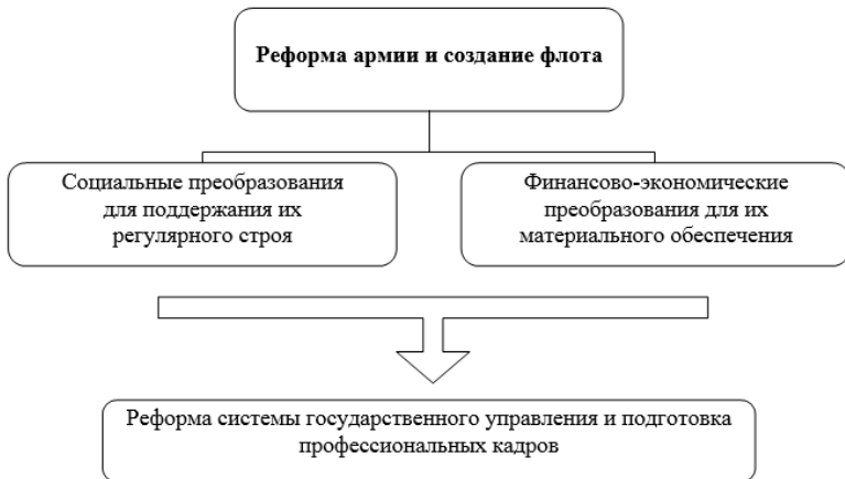
Рис. 5. Основные направления и взаимосвязь реформ

взаимосвязь реформ схематично представлены на рис. 5. Прежде всего, война вынудила начать реформу армии и расширить строительство военно-морского флота. Потребность в обеспечении и поддержании их регулярного характера повлекла социальные преобразования, т. е. окончательную унификацию социального строя. Для материального обеспечения армии и флота была осуществлена серия финансово-экономических мероприятий.