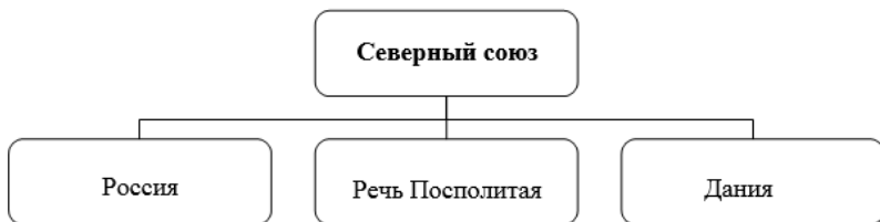
Рис. 4. Северный союз

В конце 1699 г. для войны со Швецией был официально оформлен Северный союз (рис. 4).