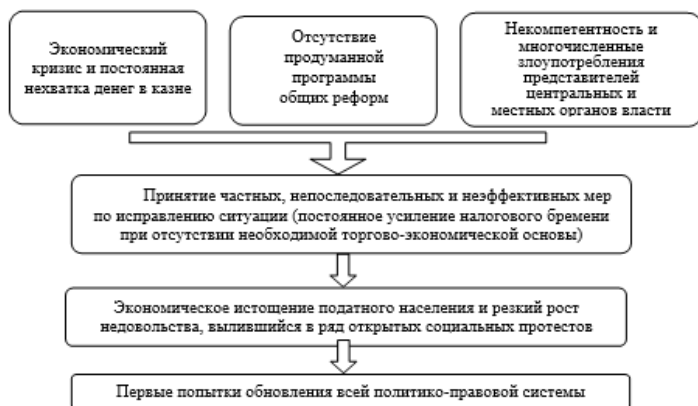
Рис. 1. Причины и последствия социальных потрясений середины XVII века

Поэтому царствование Алексея Михайловича Романова сопровождалось усиленной законодательной работой, начавшейся с принятия Соборного уложения 1649 г. На его основе был проведён ряд крупных преобразований в общественно-политической жизни Московского государства. К наиболее существенным из их числа можно отнести следующие.