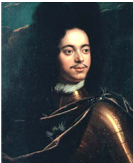
Рис. 3. Портрет молодого Петра I. Художник Г. Кнеллер

Кроме официальных Великих послов в Европу отправились 50 молодых представителей знатных родов для обучения различным специальностям. Вместе с ними ехал и сам царь под именем урядника Преображенского полка Петра Михайлова. Основные цели его путешествия состояли в следующем.