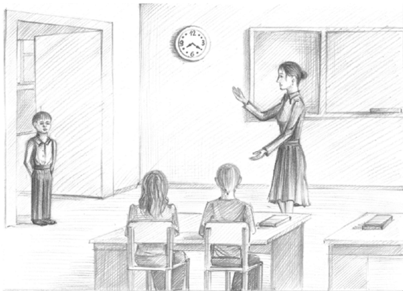
Рис. А.Г. Корчагиной-Мокеевой

Опоздание учеников на урок, увы, – не редкость. Но что же делать учителю, если это стало привычкой обучающегося. Как учителю бороться с опозданиями учеников? Предложите несколько вариантов решения данной задачи.