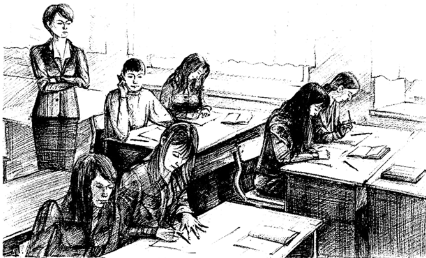
Рис. А.Г. Корчагиной-Мокеевой

Как никогда актуальной проблемой в эпоху мобильных телефонов стало «сидение» в них учеников на уроках, что отвлекает как ученика от учебного процесса, так и учителя от проведения урока. Что делать учителю? Предложите несколько вариантов решения данной проблемы.