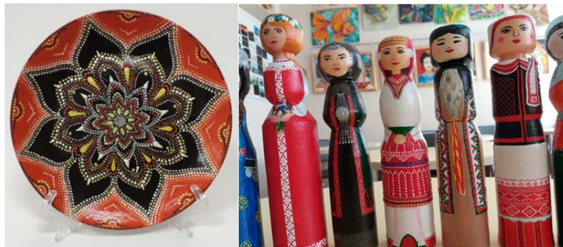
Рис. 3. Точечная роспись

Точечная роспись – вид декоративно-прикладного искусства, заключающийся в декорировании поверхности предметов точками, имеет большой потенциал в совместном творчестве. Понадобится 1–2 или больше декоративных контуров и любой предмет: шкатулка, вазочка, тарелка, баночка, корбочка. Точка за точкой создается узор, в зависимости от возраста ребенка можно усложнять узоры, добавлять окрашивание фона, создание различных сюжетов. А с самыми маленькими – взять обычный фломастер и наносить линии по предварительно вырезанной по фигуре бумаге.