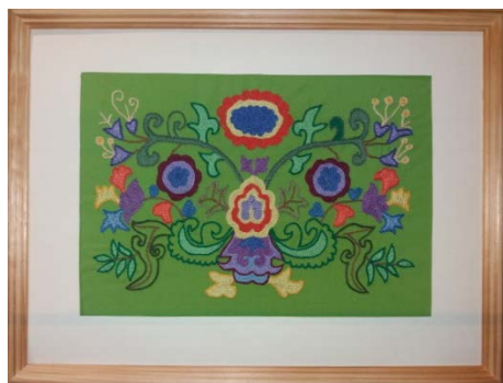
Рис. 4. Вышивка

Очень важно результаты совместного творчества по достоинству оценить, не убрать в ящик, а повесить в комнату, подарить родственникам, использовать в качестве аксессуара, отправить на конкурс. Это стимулирует желание еще создавать собственные творческие работы, творить, узнавать новые виды декоративно-прикладного искусства.