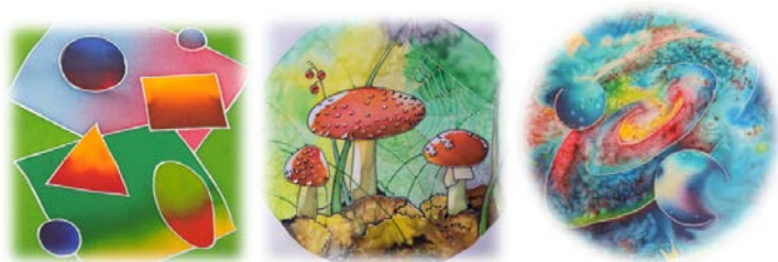
Рис. 1. Холодный батик

Для детей применимы техники холодного батика, с условием, что при работе с детьми дошкольного возраста резервирующий состав наносит родитель, либо совместно. Эскиз – картинку пусть выберет ребенок из предложенного родителем, дети по старше рисуют сами. Непосредственно роспись пусть занимается ребенок. Практика показывает, что детям очень нравится наблюдать за растеканием краски по ткани, за смешением цветов. При этом можно рассказать ребенку и на практике рассмотреть, что происходит при смешении разных цветов. Также интересна солевая техника, когда на окрашенную ткань посыпают крупы соли, соль вбирает в себя краситель, в результате чего появляются интересные узоры.