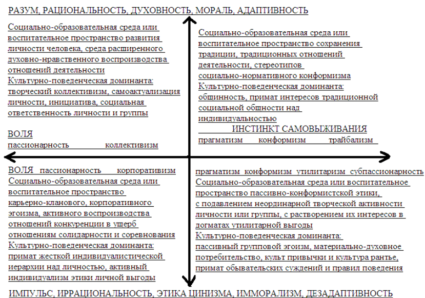
Рис. 1. Модель векторных смысловых, ценностных и поведенческих доминант, разработанная автором в 2004–2007 гг.